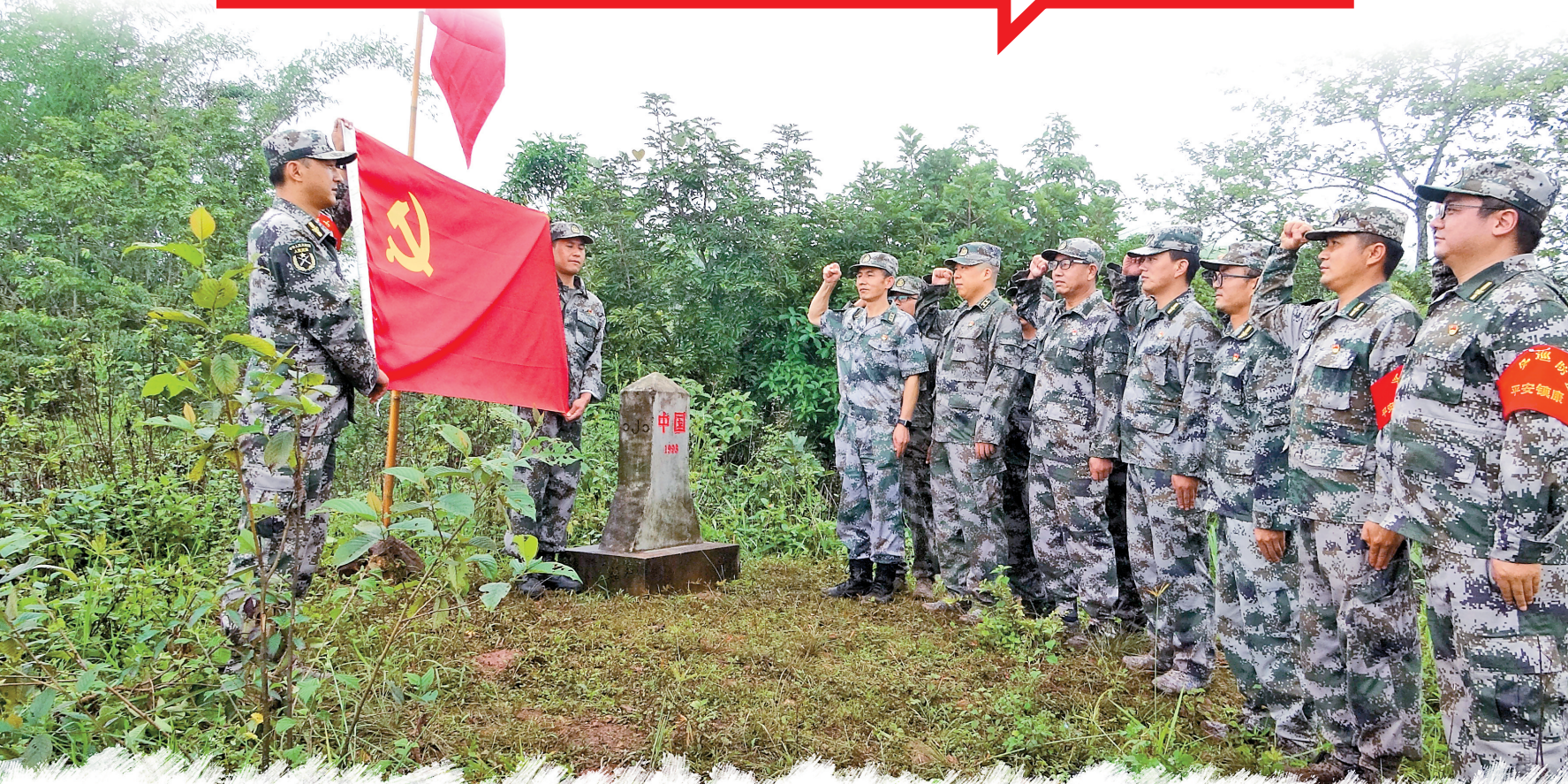
在界碑前重温入党誓词

边防即国防、守边即卫国。边境地区特殊的地理位置,更加需要强化国防意识。近年来,云南省军区立足区位,提高站位,多措并举筑牢边防民兵国防意识,数万民兵长期巡逻于八千里边防线上,一个个“民兵前哨”傲立国门。