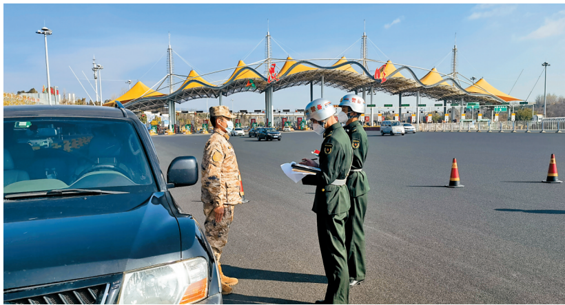
在高速公路收费站检查过往军人军车

本报讯(记者 左超 通讯员 柯穴)在省军区警备办公室的组织领导下,云南省军区警备纠察队近期共出动14批次150余人次执勤力量,开展军人军车检查纠察专项行动,切实维护驻滇部队良好形象。