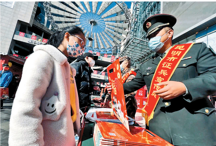
征兵宣传形式多样

记者从省征兵办了解到,目前,上半年征兵各项工作有序开展,应征报名结束后将全面展开体检、政考等各环节工作,真正把政治思想好、身体素质硬、综合素质高的优秀青年输送到部队。全省各级各部门将持续深化“一年两征”改革,全力打造“云南兵”品牌,不断提升征兵工作质量、强化廉洁征兵,确保年度征兵任务高标准高质量完成。