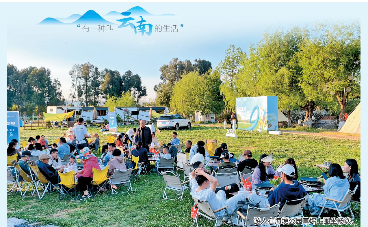
游人在海埂公园草坪上围坐畅饮。