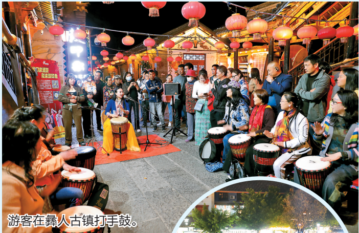
游客在彝人古镇打手鼓。