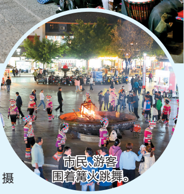
市民、游客围着篝火跳舞。