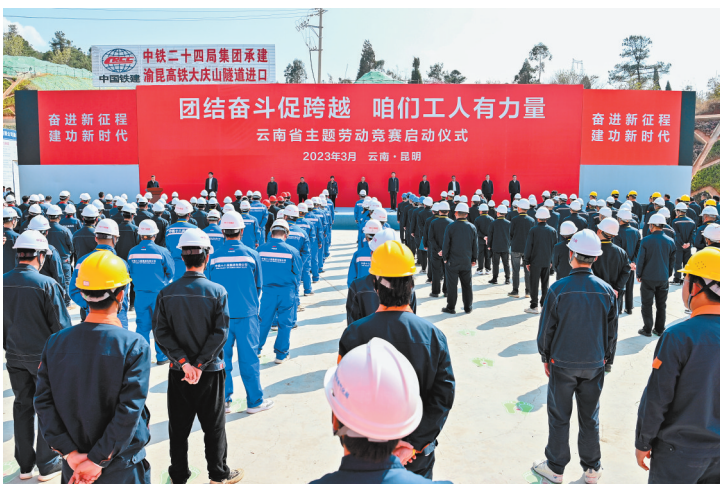
2023年云南省主题劳动竞赛启动

历史镌刻着奋斗的辉煌,也指引着未来的方向。党的二十大擘画了全面建设社会主义现代化强国、以中国式现代化全面推进中华民族伟大复兴的宏伟蓝图,站在新的历史起点上,全省各级工会正在深入学习贯彻党的二十大精神,找准“党政所需、职工所盼、工会所能”的有机结合点,不断提升工会服务大局、服务职工的能力与水平,团结动员广大职工群众在落实省委“3815”战略发展目标、谱写中国式现代化的云南篇章中再立新功。