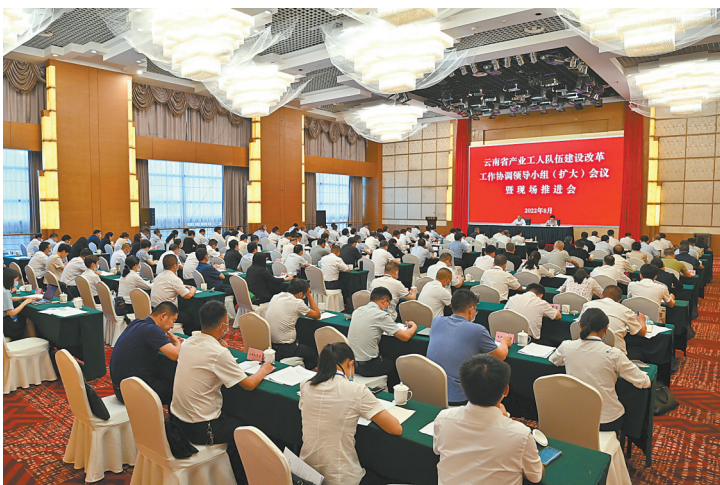
云南省产业工人队伍建设改革工作协调领导小组(扩大)会议