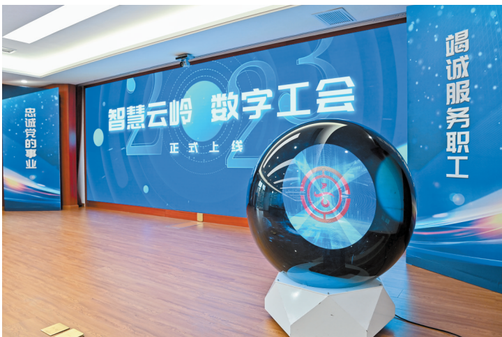
云南省数字工会上线