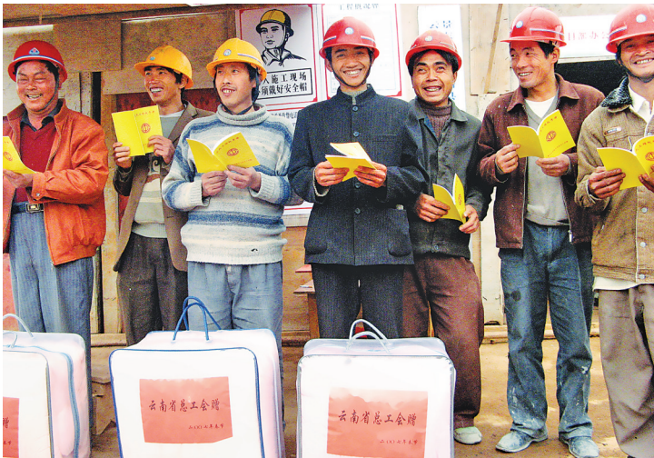
云南省总工会向农民工发放维权手册