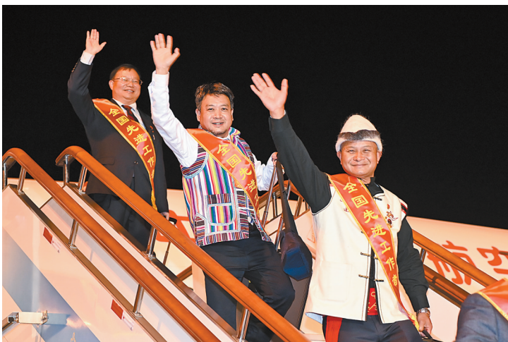
我省获得“全国先进工作者”称号的职工载誉归来