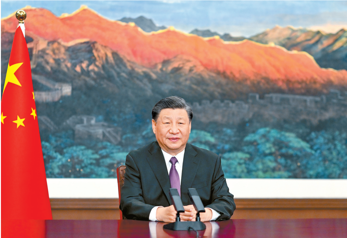
5月24日,国家主席习近平应邀以视频方式出席欧亚经济联盟第二届欧亚经济论坛全会开幕式并致辞。

新华社北京5月24日电 5月24日,国家主席习近平应邀以视频方式出席欧亚经济联盟第二届欧亚经济论坛全会开幕式并致辞。 习近平指出,当今世界正处于百年未有之大变局,世界多极化、经济全球化历史潮流势不可当。坚持真正的多边主义,推动区域协调发展,是国际社会广泛共识。亚欧大陆是世界上人口最多、国家最多、文明最具多样性的地区。面对动荡变革的世界,亚欧合作之路应该怎么走?这不仅关乎地区人民福祉,也深刻影响世界发展走向。