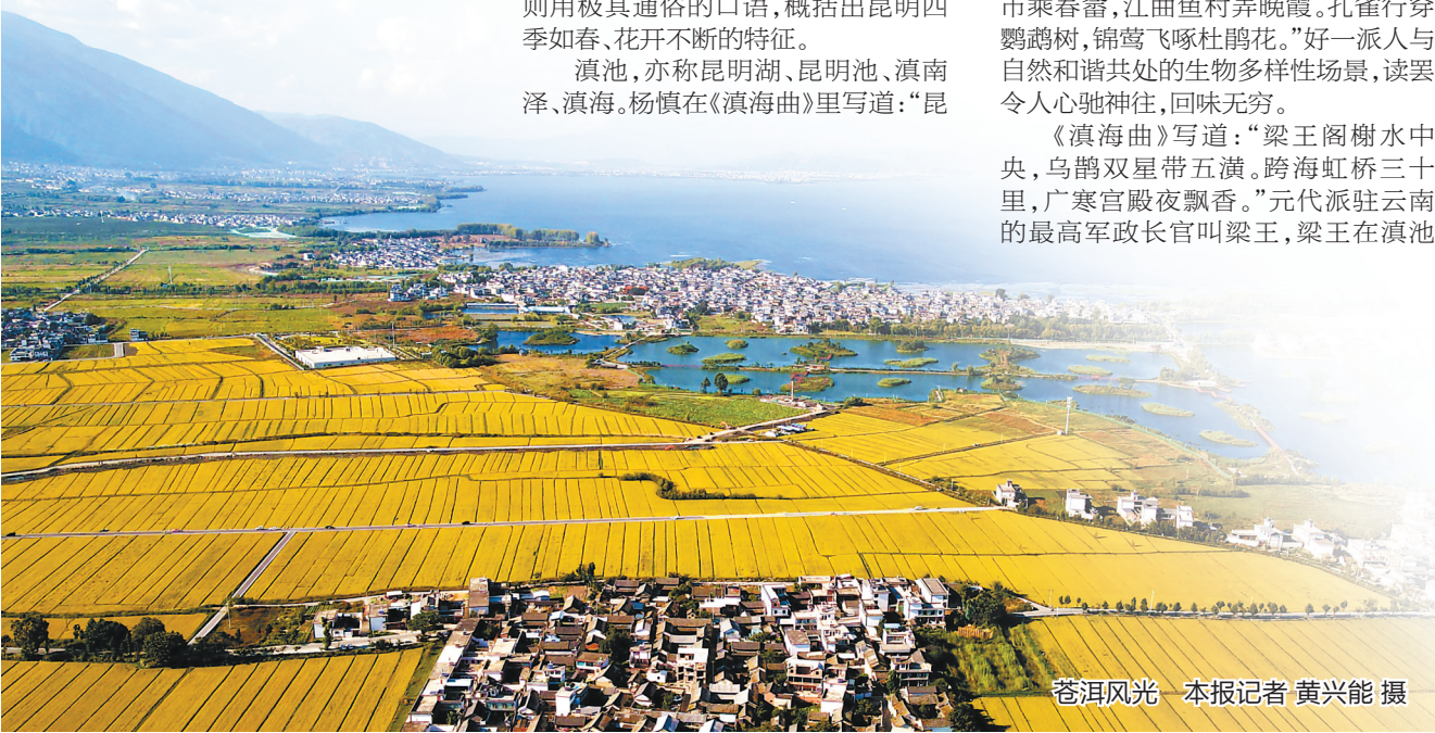
苍洱风光