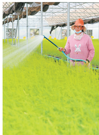
楚雄国家农业科技园种苗繁育中心

近年来,我省深入践行绿色发展理念,坚持在经济发展中促进绿色转型,在绿色转型中实现更大发展,加快推进绿色产业发展,加速绿色制造体系培育,打造绿色发展新引擎。