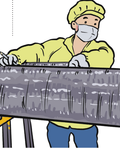
本版插画图表由 本报美编张维麟 赵行伟 绘