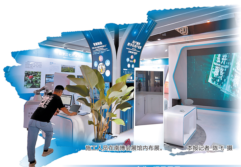
施工人员在南博会展馆内布展。

年。经过十年耕耘,这个集货物贸易、投资促进、旅游合作、文化交流等于一体的综合性博览会平台,已成为中国与南亚国家及世界其他国家交流合作的一张闪亮名片,也将为今年中国同南亚国家经贸交流画上浓墨重彩的一笔。