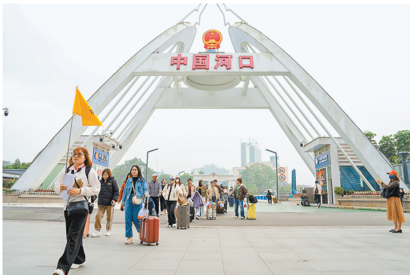
越南旅游团从河口口岸入境。

活动现场设置滇南文旅联动环节,澄江市、文山市、镇沅县、巍山县以及蒙自市、弥勒市、元阳县、屏边县的代表先后进行文旅推介,分享各地特色文旅资源与产品。澄江市、镇沅县、文山市与建水县共同签订“滇南最美乡愁之旅”文化旅游带友好城市战略合作协议。