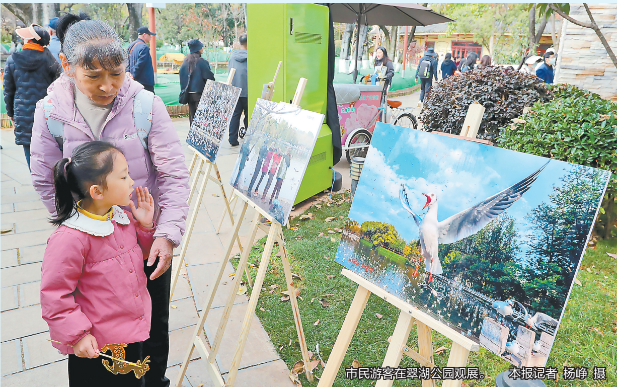
市民游客在翠湖公园观展。

本报讯(记者 王琼梅) 近日,红嘴鸥入城40周年纪念展在昆明市翠湖公园生态展览馆举办。