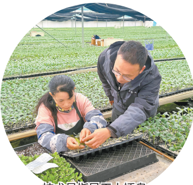
技术员指导工人插盘。

在大理百利农业发展有限公司春晓种苗基地的工厂化育苗温室中,工人们正有条不紊地为黄瓜幼苗完成南瓜砧木嫁接作业。这看似简单的一步,却是提升蔬菜产能的关键一环——比起