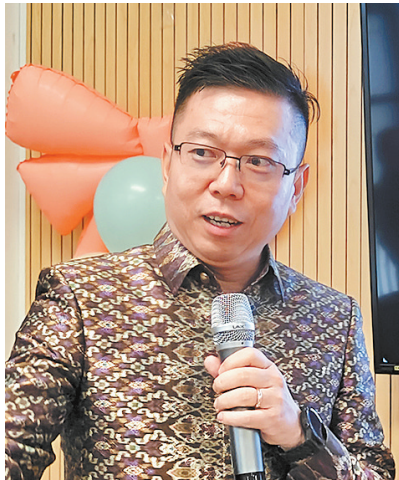
谢莫尼勒

“习近平主席的讲话清晰展现了中国国家治理的科学体系。著作中引用了老子、孔子、孟子等中国古代哲学家的名言，以通俗易懂的语言阐释了构建人类命运