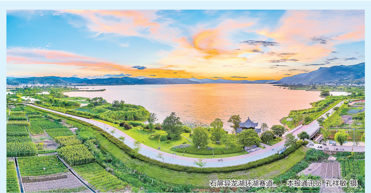
石屏异龙湖环湖赛道。

登报作废 △迟丽玲(身份证号:530129198405201328)遗失户口本,登报挂失。 △和彦梅遗失导游资格证,证号:DZG2015YN10334,登报作废。