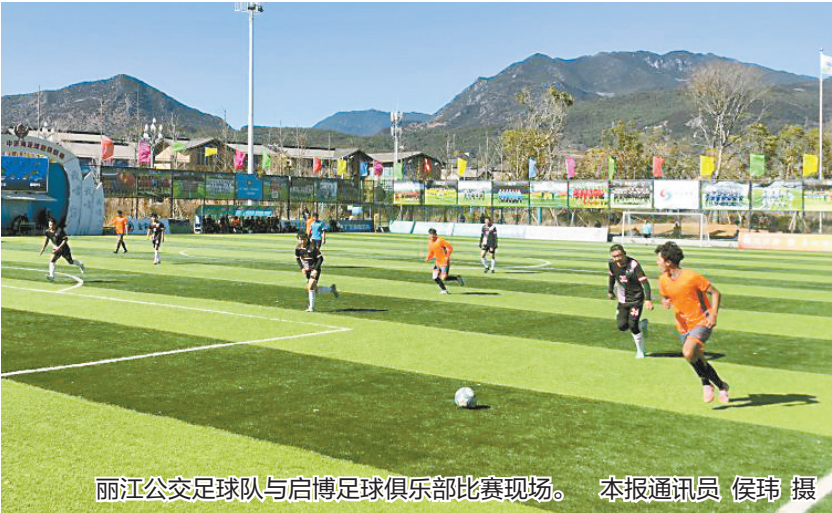
丽江公交足球队与启博足球俱乐部比赛现场。

目前,石屏异龙湖骑行赛道已建成综合性骑行主题驿站,环湖每3至5公里设置观景亭、补给点及卫生间,配备智慧导览标识与应急呼叫设备;周边联动陆来村旅居业态,云上红河艺术民宿等特色住宿可满足不同游客群体的多样需求。