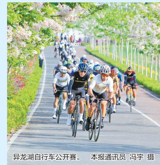
异龙湖自行车公开赛。

本报讯(记者 饶勇)近日,中国自行车运动协会发布2025“中国骑行地图”百条精品骑行线路评选结果,石屏异龙湖骑行赛道入选,是云南省唯一入选的赛道。