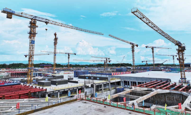
昆明市第十五水质净化厂厂外配套管线顶管施工项目施工现场。

此次厂外管线工程的全线贯通,将大幅提升官渡区、五华区、西山区以及呈贡区北部区域污水收集与处理能力,不仅为昆明市第十五水质净化厂的全面投运奠定坚实基础,更成为助推滇池生态治理的关键支撑。