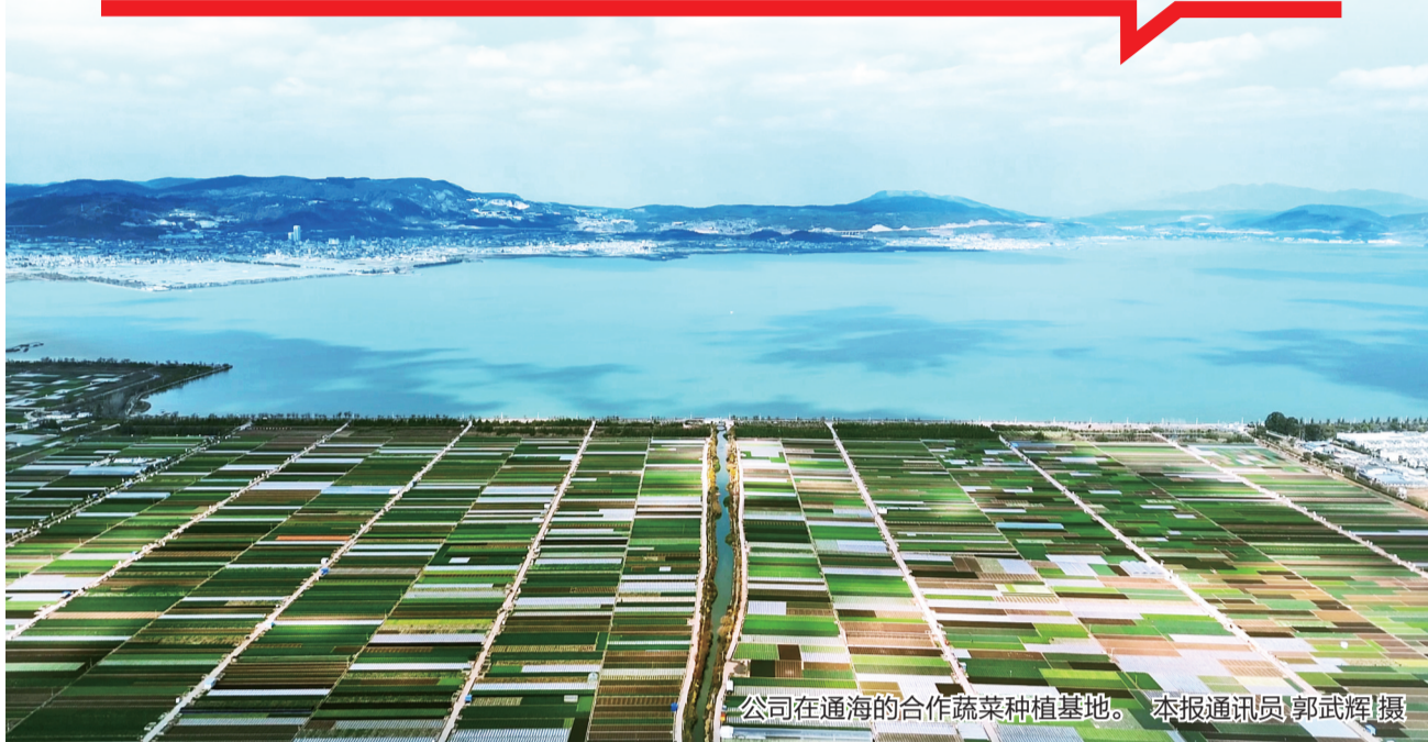
公司在通海的合作蔬菜种植基地。

这是云南绿鲜达网络科技有限公司日常清晨的景象。自2015年从昆明起步,这家企业已悄然织就一张覆盖云南多地、延伸雪域高原的食材配送网,成为连接优质产地与消费终端的桥梁。