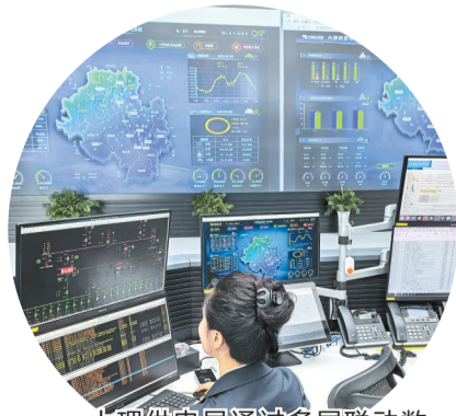
大理供电局通过多屏联动数字电网系统实时监控辖区新能源的消纳与运行。

“十四五”时期,南方电网云南大理供电局锚定“打造国际旅游名城绿色可靠智能高效电力服务标杆”目标,以电网强基为支撑,以绿色转型为方向,以数字赋能为引擎,以服务民生为初心,交出了一份量质齐升的发展答卷。5年来,全局累计完成电网投资超56亿元,推动大理白族自治州电力总装机容量突破2000万千瓦,实现100%清洁能源供电,为滇西电力枢纽建设和大理州经济社会高质量发展注入强劲动能。