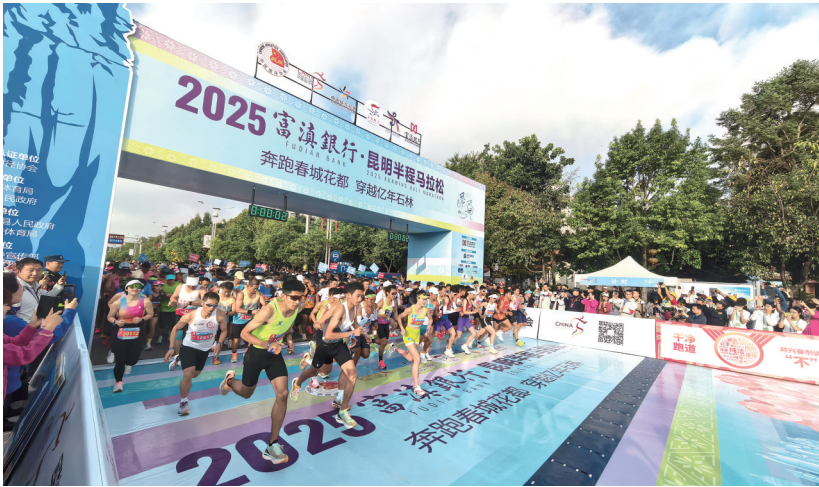
2025富滇银行昆明半程马拉松比赛开跑。