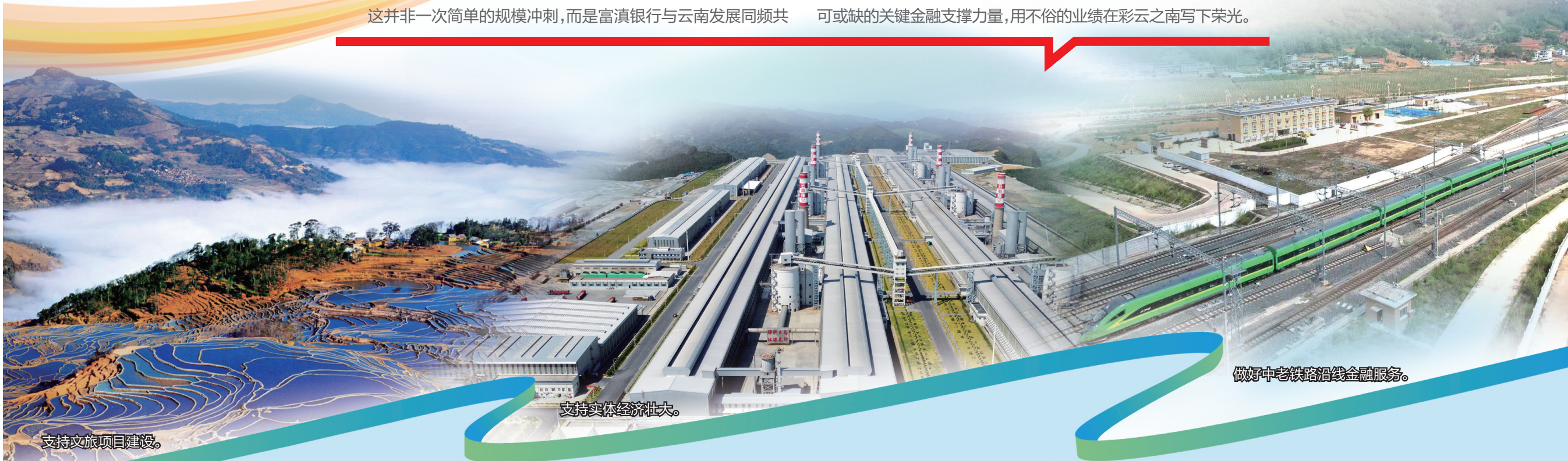
支持文旅项目建设。

振、携手共进的5年长跑。“十四五”期间,面对经济增长方式的转变与金融行业的转型升级,富滇银行给出了自己的答案:摒弃对资产规模的单一追逐,以减量提质明确发展逻辑,以特色深耕树牢竞争优势。5年间,富滇银行主动减负、强健筋骨,将金融服务的根系更深深地扎入云岭大地的产业末梢与开放前沿,在服务云南“3815”战略发展目标的征程中,以金融之为促经济之进,成长为云南经济高质量发展中不可或缺的关键金融支撑力量,用不俗的业绩在彩云之南写下荣光。