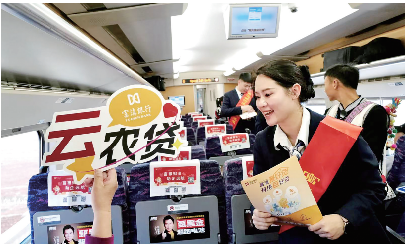
在富滇银行号高铁列车上宣传惠农产品。