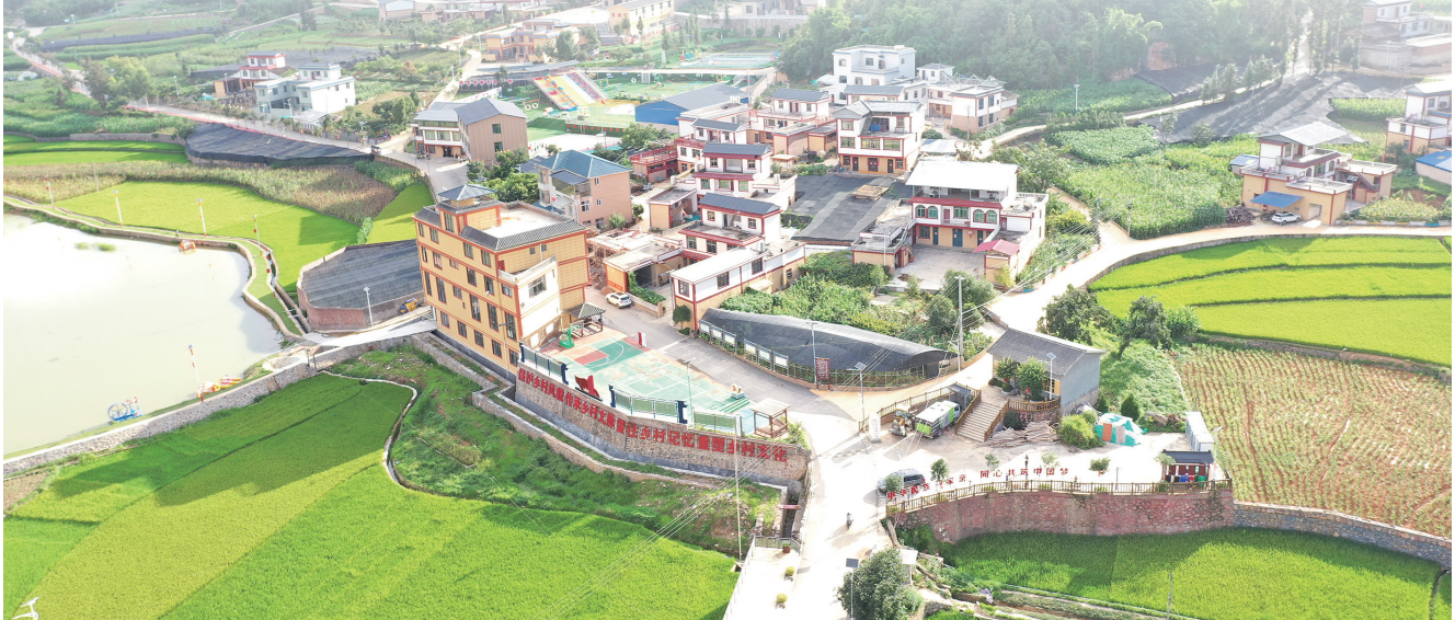
富宁县田蓬镇下寨村上寨小组。

近年来，富宁县锚定基础牢、产业兴、环境美、生活好、边疆稳、党建强的发展目标，累计投入2.41亿元，高标准推进135个边境幸福村建设。在75公里边境线上，这些村寨以“一村一策”的精准实践，让传统农业升级与特色产业崛起双向发力，绘就出边疆稳定、民族团结、群众富足的温暖图景。