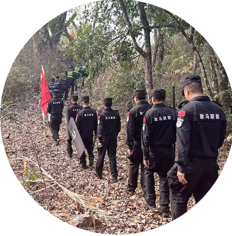
尖山村联防员日常巡逻。

目前，耿马7个沿边行政村（社区）电网供电可靠率达99.84%，农村自来水普及率、5G网络覆盖率、卫生厕所普及率、农村生活垃圾处理设施覆盖率、农村生活污水治理率均达100%，实现自然村