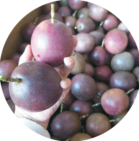
百香果喜获丰收。

回到村里，村党总支组织村“两委”、驻村干部成立产业小分队，梳理瑶家山村的自然条件：年平均气温18.5℃、阳光充足、降水充沛，海拔在1000米至1500米的微酸性土壤，契合百香果生长需求。为说服村民试种，村干部挨家挨户算“生态账”“收益账”，还带着企业技术员上门