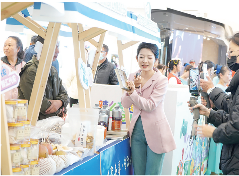
大理市通过“人才交流+线下展销+线上直播”的创新模式推动乡村产业发展。

在洱海之畔的大理市喜洲镇金河村，通过推行“1+N”党员结对模式，200余名党员主动结对N户农户，并当好促农增收“带头人”，党员带头融入农文旅发展大局，有力帮助农民增收，让乡村旅游产业焕发出勃勃生机。如今，金河村的乡村旅游产业不仅带动600余名村民“家门口”就业，还推动农民人均可支配收入年均增幅达7%。