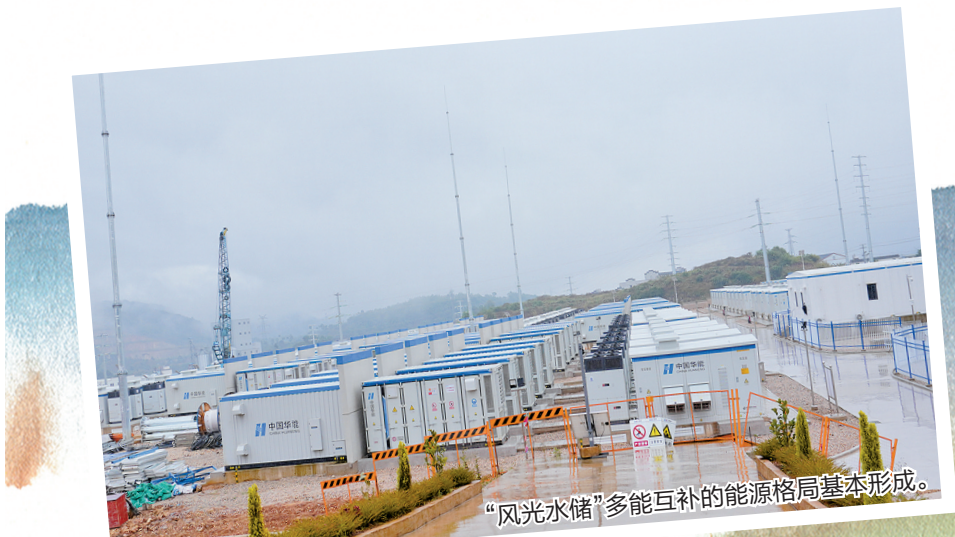
“风光水储”多能互补的能源格局基本形成。