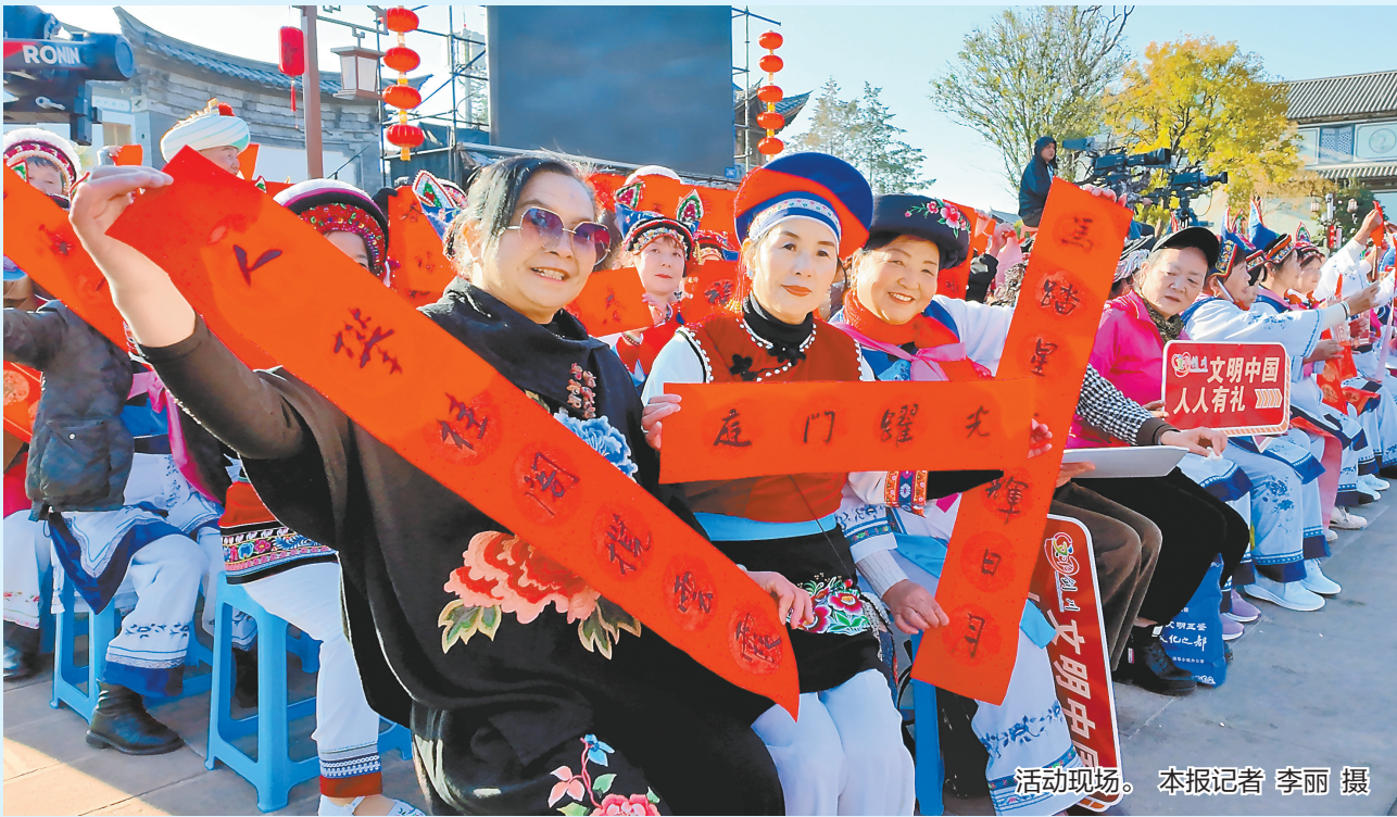
活动现场。

本报讯(记者 李丽 秦琳琳) 2月8日,2026年全国“我们的节日·春节”主题文化活动暨“联墨飘香迎新春·古韵新风颂文明”原创楹联诗词展示活动在大理白族自治州剑川县举行。活动以楹联诗词为核心载体,融合中华优秀传统文化与云南本土民俗特色,为全国观众献上了一场精彩的新春文化盛宴。 剑川是国家历史文化名城,素有“楹联之乡”美誉。楹联在当地传承两百余年,形成了“全民参与、自撰自书”的创作传统,楹联文化深深融入民众日常生活。剑川楹联入选省级非物质文化遗产代表性项目,成为非遗与文旅融合、传统与现代对话的鲜活样本。 活动现场,名家云集,热闹非凡。一系列融合楹联、诗词与民族文化元素的精品文艺节目轮番上演。经典诗词与白族童谣、非遗民歌创新相融,以白族家训为蓝本的情景歌舞温情演绎,朗诵名家携手当地小学生共诵天下名联,让观众沉浸式感受传统文化的魅力。多位文化名家现场讲诗,解读春节与楹联文化的丰富内涵,讲述大理本土文化与楹联的深厚联结。 活动现场还设置了“写春联、画门画、送祝福”专区,全国书法家现场挥毫,写春联、送“福”字,把新春祝福送到群众手中。特色非遗市集上,剑川木雕、布扎、甲马版画等本土非遗技艺集中展演;楹联诗词展、春联赏析等同步举行,市民和游客品联、赏联、写联,感悟楹联文化的深厚底蕴。