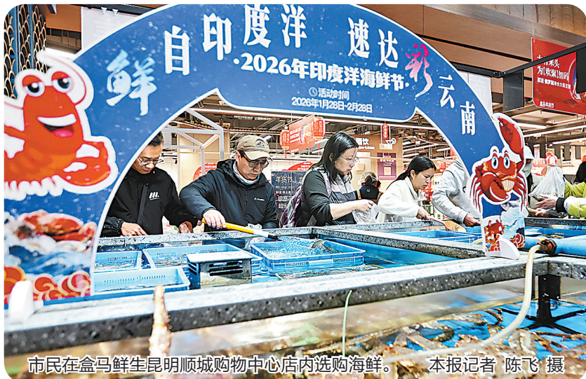
市民在盒马鲜生昆明顺城购物中心店内选购海鲜。

2月16日中午,滇池之畔晴空万里,附近的餐厅里暖意融融。 快乐海鲜餐厅大堂里,烫金的“福”字、大红灯笼、马年元素精心点缀,共同烘托出浓浓的年味。餐厅副总经理王向东30多年来都在工作一线度过春节。今年,她和同事也早早为年夜饭开始了忙碌。 “不少顾客去年就餐的时候,就提前预订了今年的年夜饭。除夕当天下午5点开餐,能容纳80桌600多位客人就餐。”王向东说,今年餐厅的菜品种类有了不少新变化和 new 味道,商务系统发放的印度洋海鲜消费券,让顾客能以更实惠的价格品尝马来西亚东里斑等菜品。春节期间,餐厅顾客主要来自云南、四川、广东等省市区以及新加坡、马来西亚等国家和地区,餐厅不断加强粤菜与云南菜的融合,黑松露牛油焗龙虾等菜品受到欢迎。