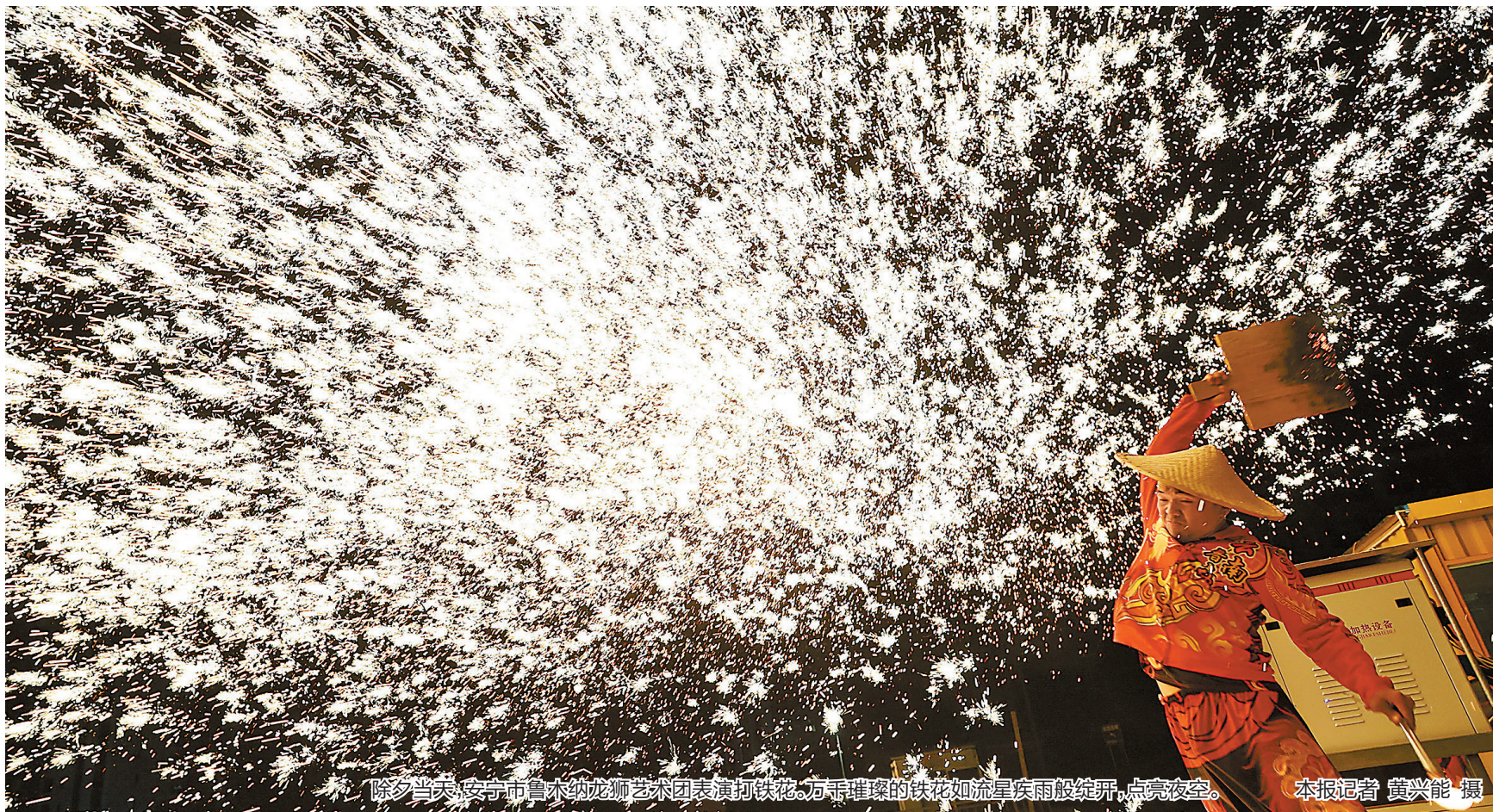
除夕当天,昆明市鲁木纳龙狮艺术团表演打铁花,万朵璀璨的铁花如流星疾雨般绽开,点亮夜空。

除夕清晨,阳光洒满丽江古城。丽江木府内,身着纳西族“披星戴月”传统服饰的讲解员,用纳西语和普通话向屏幕前的观众送上新春问候,一场沉浸式纳西年俗直播正式开启。 “朋友们,新年好!今天带大家过一个地道的纳西年!”讲解员边走边讲,从“达瓦纳西努”的年份由来,到家家户户备年货、吃年夜饭的传统习俗,娓娓道出纳西族独有的年味。 直播镜头转向忠义市场,商贩吆喝,小吃煎炸、付款提示音交织成热闹的新春市井交响曲。讲解员背着背篓选购春联、粉皮、山茶花等年货,纳西语与普通话自然切换,讨价还价间满是烟火温情。往来游客驻足镜头前,共贺新春,民族交融的暖意与新春的喜悦扑面而来。