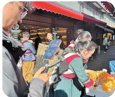
直播采购年货。