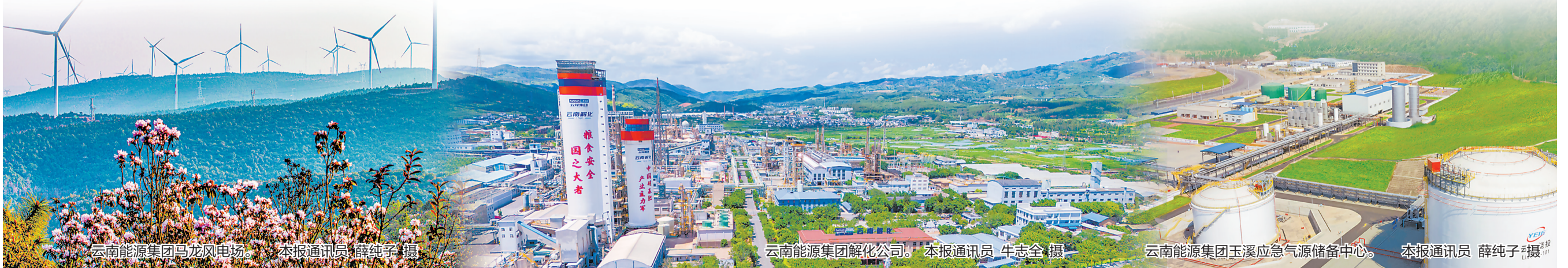
云南能源集团马龙风电场。

春风又度，征程再启。云南能源集团始终牢记省属国企使命，以思想融合聚合合力，以全链协同提质增效，以项目投资强动能，持续用自身努力的确定性应对外部环境的不确定性，全力以赴稳经营、保安全、促转型，为全省经济稳增长和绿色能源强省建设贡献更大力量。