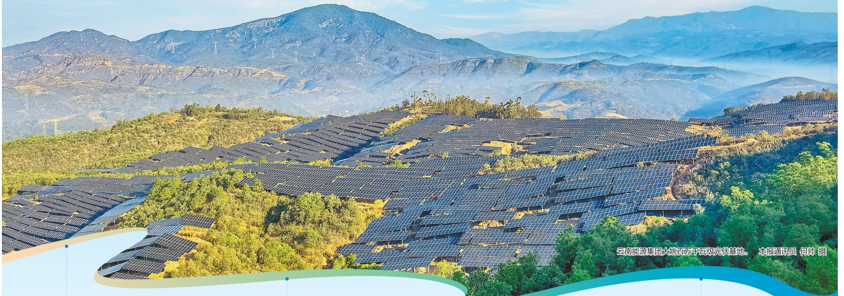
云南能源集团大姚百万千瓦级光伏基地。

强化新型能源项目开发，稳步推进新型能源系统建设。集团锚定“全国一流绿色能源企业”的使命愿景，持续做大做强“8+X”支柱产业，扎实推进风光水火储、源网荷储、煤电新能源“三个一体化”发展，加快构建覆盖能源全链条协同发展的新型能源系统，因地制宜培育和发展新质生产力，全力扛起全省能源产业高质量发展“主平台”“主力军”的担当。