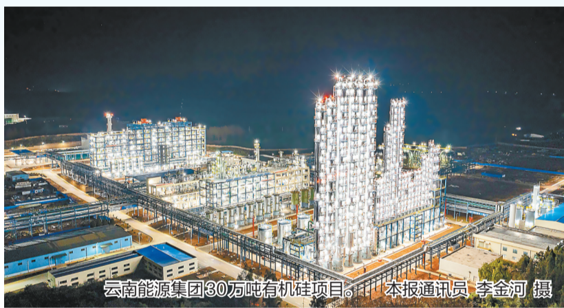
云南能源集团30万吨有机硅项目。

云南能源集团组建恰逢“十五五”开局起步之际，整合任务千头万绪、板块壁垒亟待破除，叠加行业周期波动、市场供需调整，单一板块、分散经营难以抵御系统性风险，唯有以思想铸魂、以协同破局，才能在逆境中站稳脚跟、凝聚合力。集团以树立和践行正确政绩观为引领，推动全体干部职工从利益共同体向事业共同体、命运共同体深度融合，以“四个共同”——共同信念、共同愿景、共同目标、共同价值观和行为准则凝聚全员共识；以“四个穿透”——穿透党的领导、穿透战略意图、穿透管理理念、穿透价值导向，汇聚发展合力、夯实行动根基，全面打破板块壁垒、摒弃本位主义，引导2.7万名干部职工树牢“云能人”身份认同，形成“你中有我、我中有你”的协同格局，将思想共识转化为抵御风