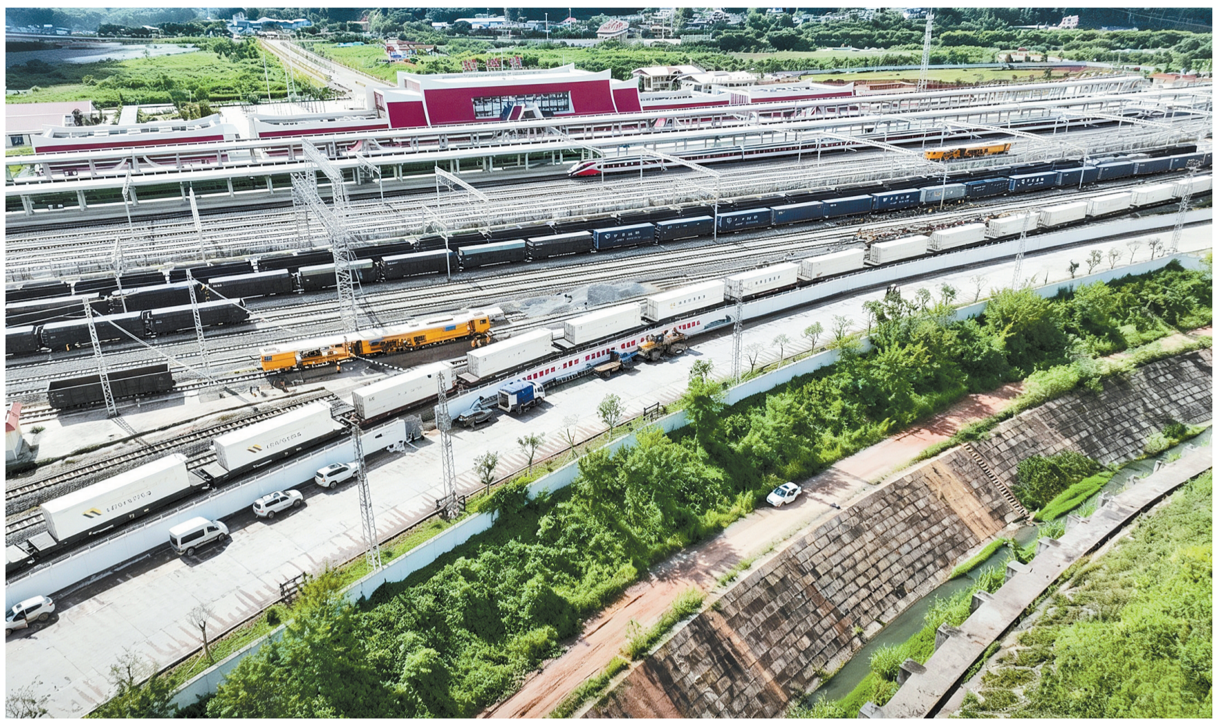
中老铁路

本报讯(记者刘子语)据昆明海关所属腊海海关统计,中老铁路通车运营以来,截至今年4月7日,进出口货值已超800亿元。中老铁路正成为促进“中国制造南下、东南亚特产北上”的双向贸易高效通道,进出口商品品类已从通车初期的500余种拓展至3800余种,运输服务覆盖全国超6000家企业,辐射老挝、泰国等19个国家和地区,“黄金大道”活力持续迸发。