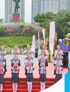
聂耳音乐周里，举办同升国旗同唱国歌活动。