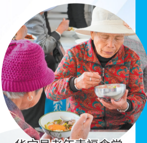
华宁县老年幸福食堂。

以老旧小区改造为契机，全市已打造28个“和美一家”互嵌式社区，各族群众共居共学、共建共享、共事共乐，真正实现“进得来、留得住、融得好”。5年来，玉溪投入2.48亿元资金实施209个“十百千万”示范引领项目，从示范点到示范社区，一项项民生实事落地生根。“十四五”期间，45个民族文化项目让优秀传统文化焕发新彩；32家民贸民品企业享受贷款贴息2178.70万元，发展更有动力；学校普通话推广率达100%，450个国家通用语言文字普及村建设完成——语言相通了，心贴得更近了。