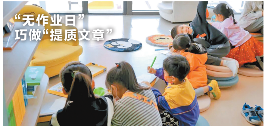
“无作业日”的玉溪青溪书店内，聚集了阅读绘本的学生。

澄江市委旅游工作委员会定期研究全市旅游旅居工作，强化党对文旅产业的统筹领导，“一盘棋”对全市旅游资源、力量和要素保障进行有效整合，牢牢把握全市旅游产业发展方向。澄江市还着力构建柔性引才、产才融合、生态赋能的人才发展模式，让旅居人才引得进、留得住、能发展。同时，澄江市不断完善旅居人才服务体系，向符合条件的旅居人才发放“兴玉英才卡”，提供系统人才礼遇。