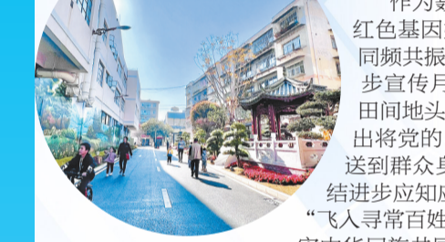
全市打造28个“和美一家”互嵌式社区。