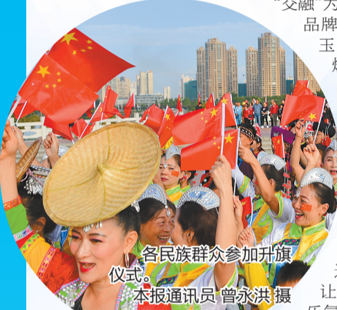
各族群众参加升旗仪式。

这里生活着汉族、彝族、傣族、回族等民族，各族儿女手足相亲、守望相助；这里是国歌作曲者聂耳的故乡，红色血脉里激荡着“同唱一首歌”的家国情怀；这里正以铸牢中华民族共同体意识为主线，把民族团结进步融入城市的每一寸土壤……这里是玉溪，一座持续推动各族群众在空间、文化、经济、社会、心理等方面全方位互嵌互融的城市。如今，“同唱一首歌 同为一家人”这句温暖有力的话语，已成为玉溪最动人的旋律。