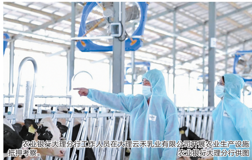
农业银行大理分行工作人员在大理云禾乳业有限公司开展农业生产设施抵押考察。

人民银行大理州分行积极探索并推动“农村集体经营性建设用地使用权+厂房”组合抵押融资模式落地，重点支持农业基础设施建设。同时，强化政策引导，指导辖区金融机构加大对设施农业的信贷资源倾斜。截至2月末，大理