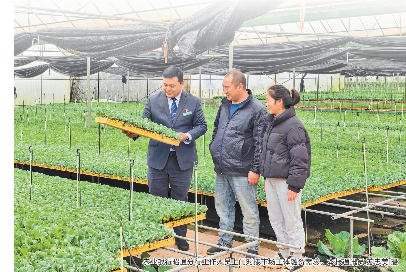
农业银行昭通分行工作人员上门对接市场主体融资需求。