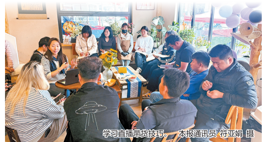
学习直播带货技巧。