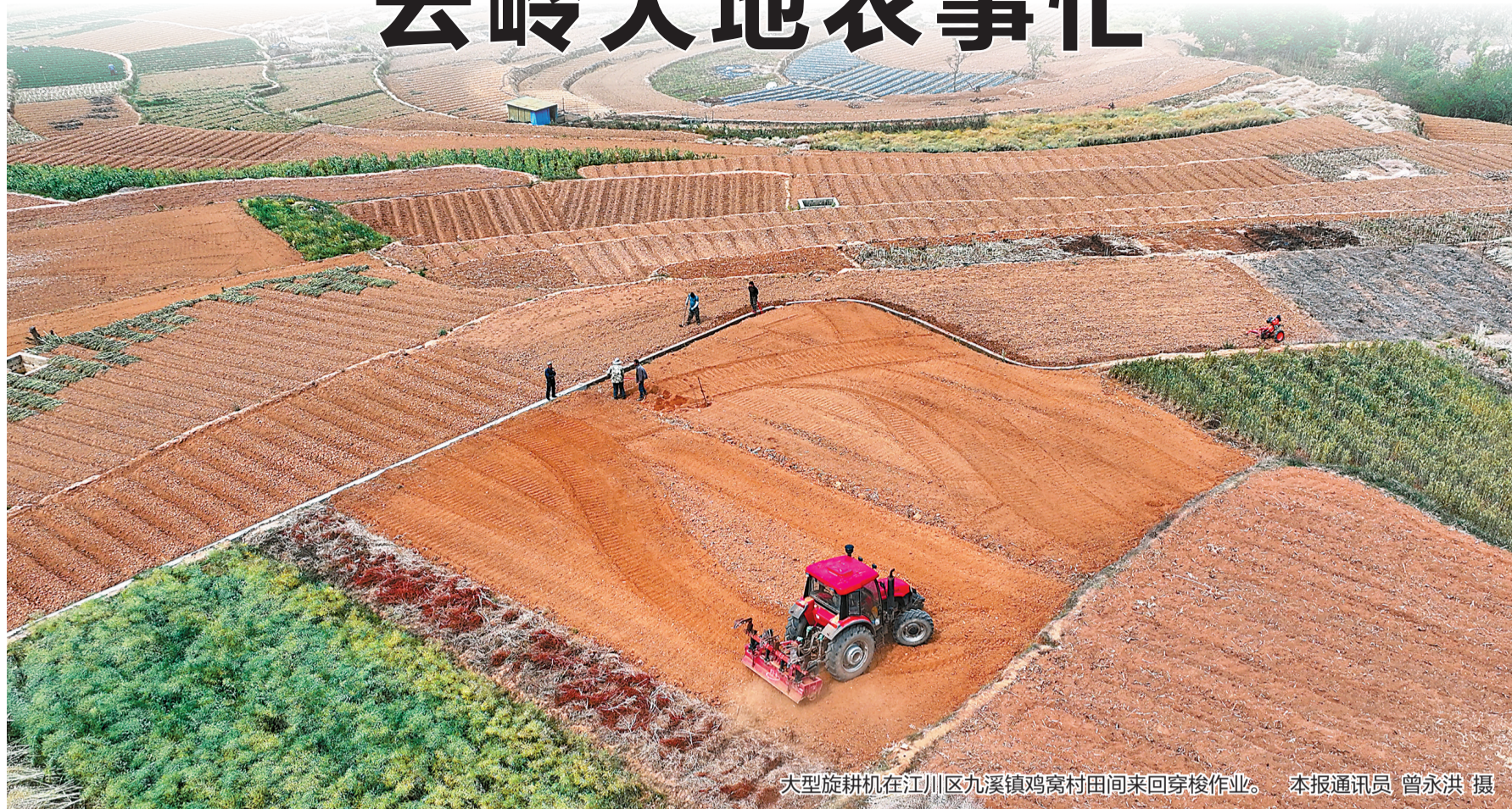
大型旋耕机在江川区九溪镇鸡窝村田间来回穿梭作业。