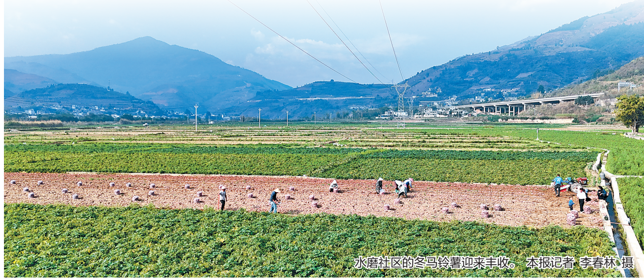
水磨社区的冬马铃薯迎来丰收。