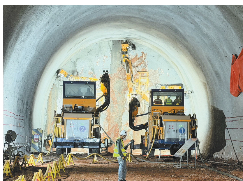
新安所隧道内，两台全电脑三臂凿岩台车同步开展“双机并打”作业。

在开挖工序方面，采用两台全电脑三臂凿岩台车“双机并打”作业，设计229个炮眼，最短用时67分钟打设完成，平均用时1.5小时以内，大幅降低人工成本及安全风险，提升了施工质量。在初期支护中，成套机械的协同优势更加凸显，钢拱架安装采用