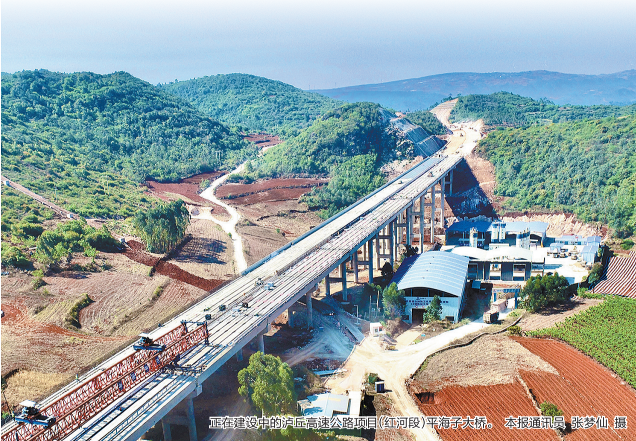
正在建设中的沪昆高速公路项目(红河段)平海子大桥。

本报讯(记者 龙舟 通讯员 张梦仙) 近日，随着最后一块T梁精准落位，由中国一冶承建的沪昆至丘北至广南至富宁高速公路(红河段)项目平海子大桥T梁架设任务圆满完成，该桥施工取得了又一阶段性进展，为项目按期通车奠定了坚实基础。 平海子大桥位于泸西县永宁乡大沙