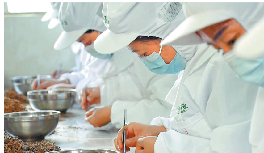
凤庆红茶制作。

作为世界茶树的发源地之一，凤庆因一杯“滇红”闻名遐迩。从烽火岁月里临危创制、支援抗战的“救命茶”，到新时代助力乡村振兴、富民兴县的“幸福茶”，88载风雨兼程，“凤庆滇红”以一脉醇香，成为镌刻在凤庆青山绿水间的红色印记与产业丰碑。