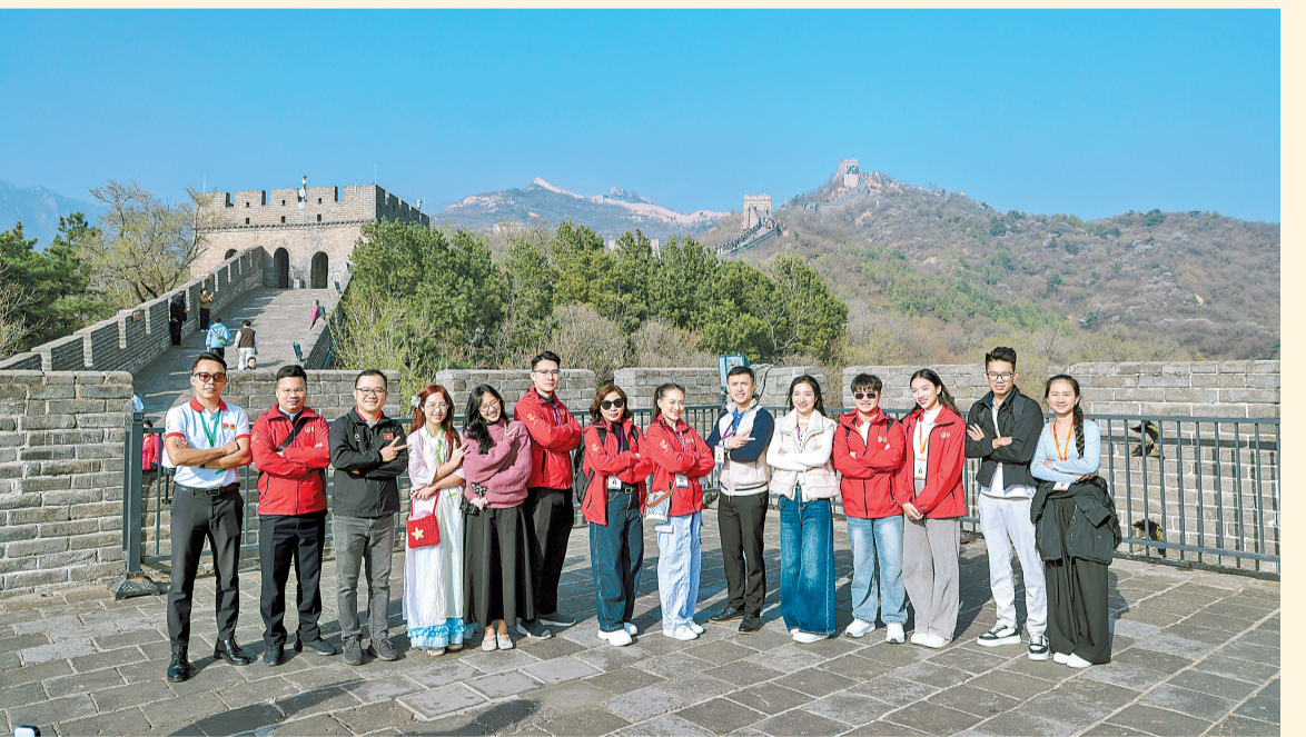
4月14日,中越青年在北京参观八达岭长城。