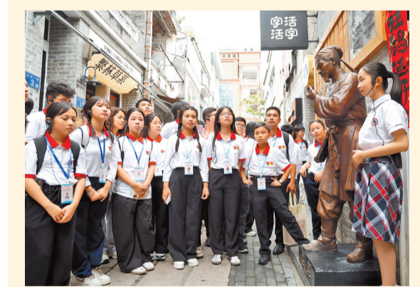
4月12日,越南青年研学营成员在广州永庆坊了解活字印刷相关知识。

4月11日至18日,越南青年来华“红色研学之旅”之“不忘初心”研学营在北京、广州举办。200名越南各界青少年代表来华研学。据悉,2025年5月至2026年3月,越南青年来华“红色研学之旅”项目已在全国10个省(区、市)举办8期主题研学营,累计1000余名越南青少年参加。