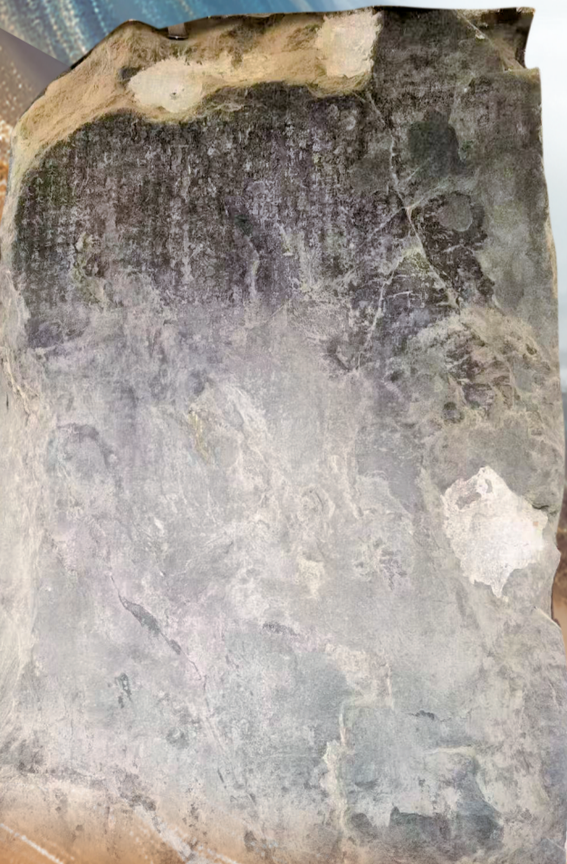
南诏德化碑