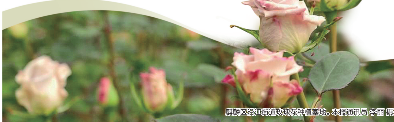
麒麟区沿江街道玫瑰花种植基地。