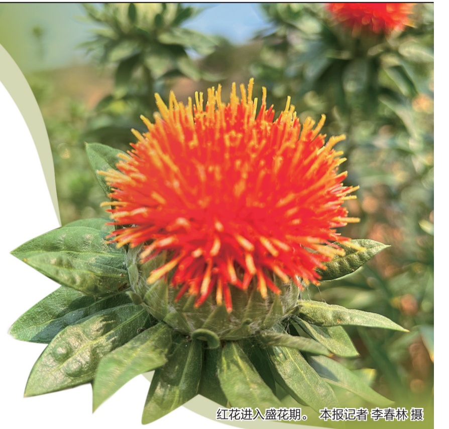
红花进入盛花期。