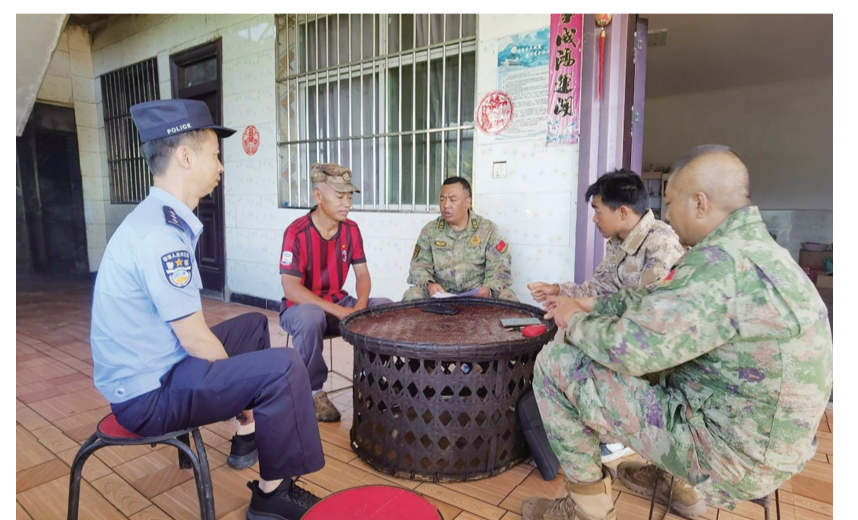
义警队调解纠纷。

地处沧源佤族自治县边境线上的单甲乡，群众居住分散，传统走访模式难以实现全域覆盖，一度面临“敲不开门、说不上话”的治理困境。为破解这一难题，单甲乡立足边境治理实际，结合当地“月亮”民俗传说，整合村组干部、寨老、热心群众等力量，在嘎多村率先组建“月亮之家”巡防队。随着治理成效逐步显现，队伍不断发展壮大，如今已覆盖单甲乡全域，巡防队改为义警队，队员从10人增加到近百人，成为守护边境平安、化解邻里矛盾的重要力量。