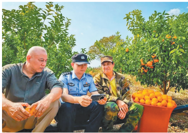
元阳公安到果园里进行反诈宣传。

近年来，红河哈尼族彝族自治州各级法院、公安机关立足当地民族众多、边境线长、产业多元的实际，聚焦基层治理、民生保障、生态保护、非遗传承等重点领域，创新工作模式、整合资源力量、下沉服务重心，将法治温度传递到群众身边，为边疆稳定、产业兴旺、生态优美、民生幸福筑牢法治屏障。