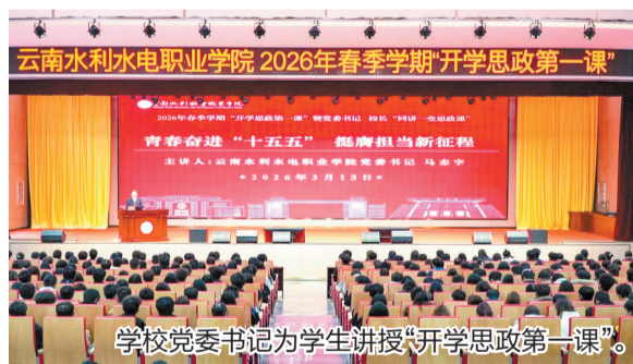
学校党委书记为学生讲授“开学思政第一课”。

“从基层一线到重大工程，从西南边疆到东部沿海，60000余名高素质技术技能人才的奋斗足迹，正是云水职人为中华民族伟大复兴贡献的坚实力量。”黄海燕表示，站在新的历史起点，云南水利水电职业学院将立足职教使命，扎根云岭大地，追求卓越高远，开拓进取、勇毅前行，全面建设特色鲜明的区域性高水平高职院校，为培养高素质技术技能人才、服务地方发展贡献云水职力量。