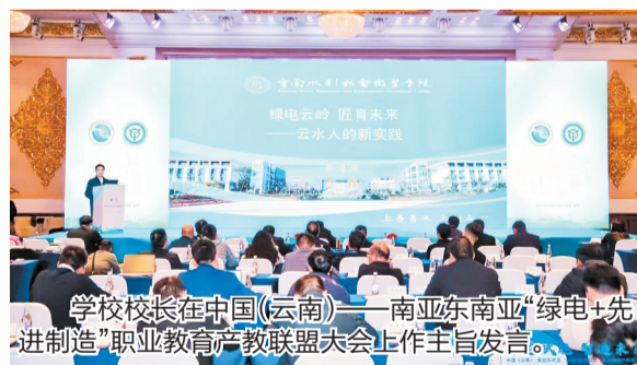
学校校长在中国（云南）—南亚东南亚“绿电+先进制造”职业教育产教联盟大会上作主旨发言。