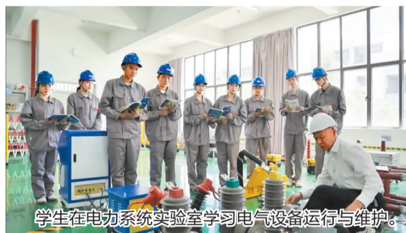
学生在电力系统实验室学习电气设备运行与维护。