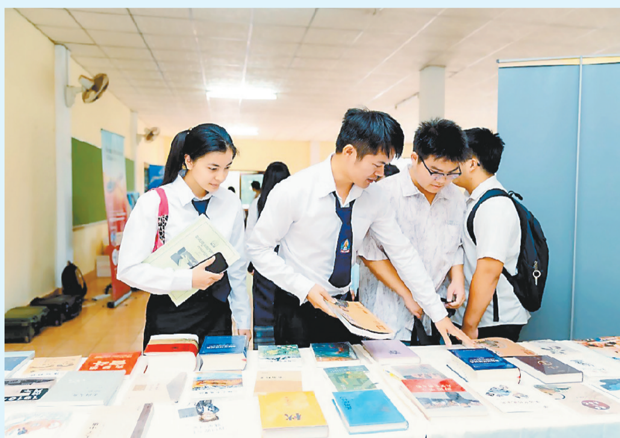
老挝国立大学学生在活动现场阅读精选图书。