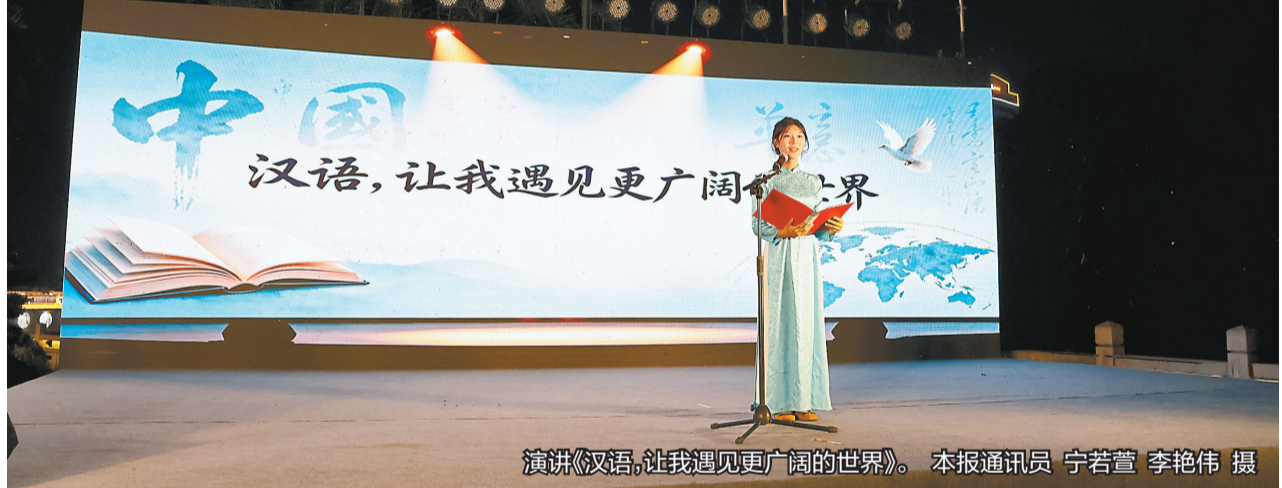
演讲《汉语，让我遇见更广阔的世界》。

本报讯(记者 黄楚楚 通讯员 宁若萱 李艳伟)4月22日，河口瑶族自治县2026年全民阅读启动仪式暨第四届“中越经典咏流传”诵读交流活动举行。中越两国人民以诵读为桥，以经典为媒，在悠悠书声中赓续“同志加兄弟”的深厚情谊，共话美好未来。 当晚的活动精彩纷呈，在演讲《小