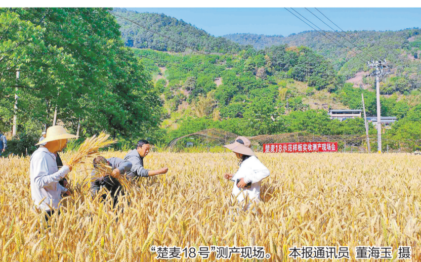
“楚麦18号”测产现场。

术集成应用，降低了生产投入，亩均增产增收效果明显，能切实带动种植农户降本增效，为半山区小麦绿色高效栽培、单产稳步提升提供了可借