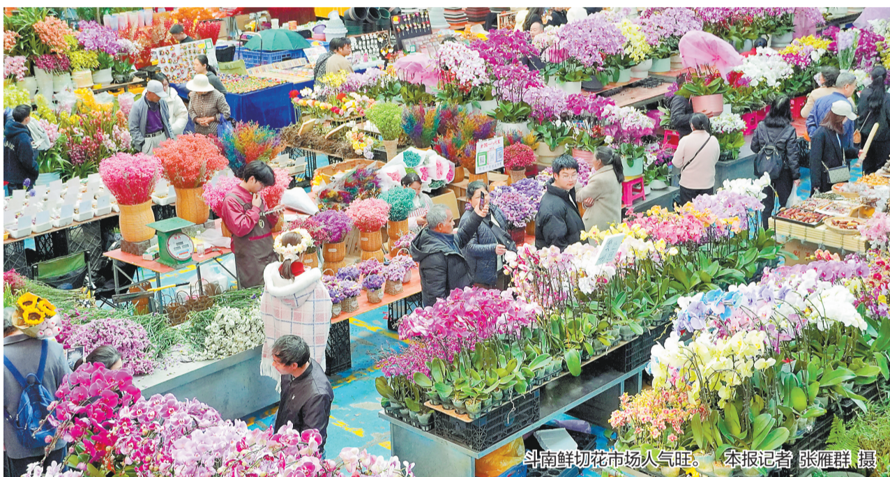
斗南鲜切花市场人气旺。

本报讯(记者 张雁群)近日，斗南鲜切花市场发布4月销售榜单。数据显示，斗南鲜切花市场供货足、需求旺，价格保持平稳、品类不断优化。