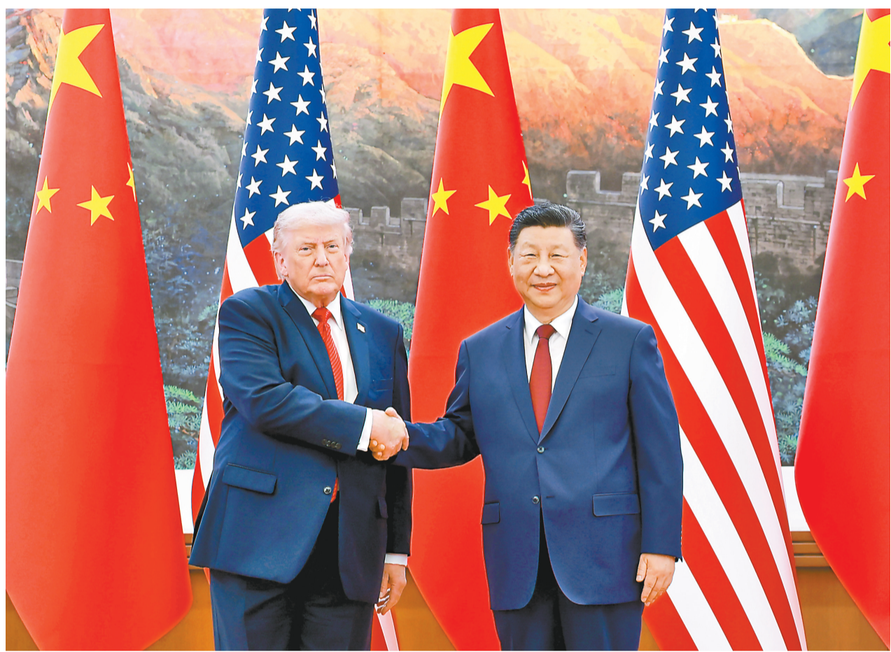
5月14日上午,国家主席习近平在北京人民大会堂同来华进行国事访问的美国总统特朗普举行会谈。