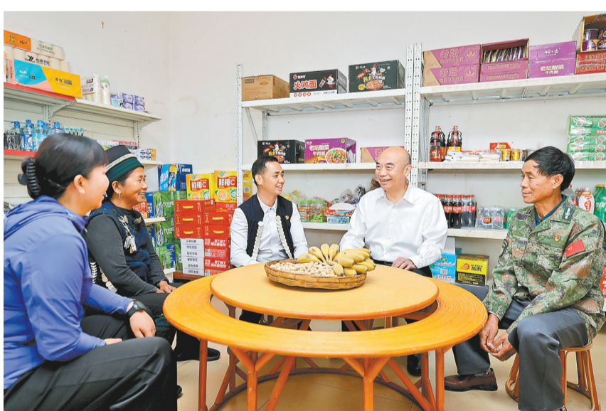
5月13日,刘国中在红河州调研帮扶产业发展和驻村帮扶情况,走访脱贫户。

新华社昆明5月14日电 中共中央政治局委员、国务院副总理刘国中12日至14日到云南调研。他强调,要深入学习贯彻习近平总书记重要讲话和重要指示批示精神,落实党中央、国务院部署,压紧压实责任,抓实抓细常态化精准帮扶工作,持续巩固拓展脱贫攻坚成果,促进乡村全面振兴,为推进中国式现代化提供基础支撑。刘国中先后来到玉溪市、红河州和文山州,深入脱贫村、产业基地、帮扶车间、易地搬迁社区和学校、乡镇卫生院,走访防止返贫致贫对象和脱贫户,调研“三保障”和产业发展帮扶等工作情况。他强调,今年是开展常态化帮扶第一年,要做好政策与工作衔接,守牢不发生规模性返贫致贫底线。要健全完善监测帮扶体系,科学确定和动态调整帮扶对象,做到早发现、早干预、早帮扶。要精准落实教育、健康帮扶和住房安全保障政策,持续巩固农村饮水安全保障成果。要因地制宜加强产业分类指导和长期培育,健全帮扶项目资产长效管理机制,多渠道做好就业帮扶,促进农民增收。要继续做好易地搬迁后续扶持,确保搬迁群众稳得住、逐步能致富。要将符合条件的帮扶对象及时纳入社会救助范围,统筹用好农村公益性岗位,兜牢民生保障底线。要分层分类帮扶欠发达地区,集中支持乡村振兴重点帮扶县加快发展,激发内生动力。要加强考核