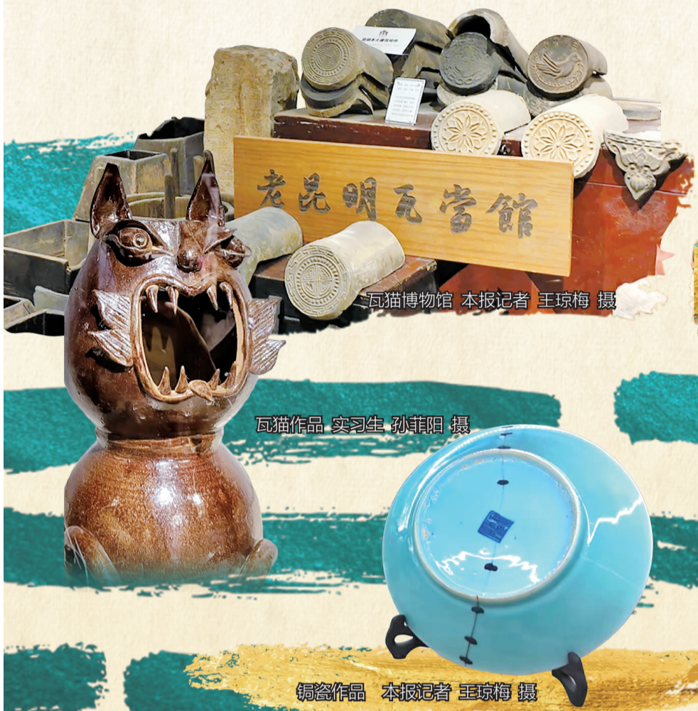
瓦猫博物馆

瓦猫博物馆、铜瓷博物馆、乌铜走银博物馆、云南斑铜展销中心，这些藏在春城角角落落的小博物馆，称得上昆明动人的“文化宝藏”。它们避开了知名场馆的人流如织，却将老昆明的烟火匠心与时光韵味，妥帖地封存在了一方方静谧天地里。它们让散落在民间的技艺，不再是书本上模糊的文字，而化作了可触摸、可凝视、可感知的鲜活存在，成为云南文化诗行里，最耐人寻味的韵脚。