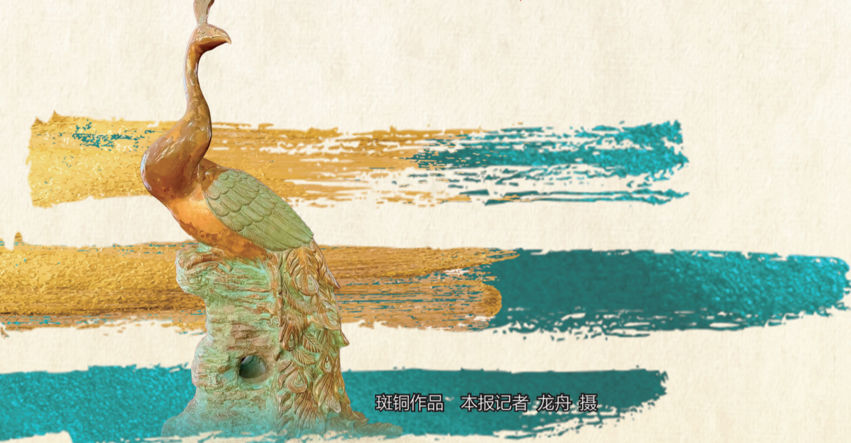
斑铜作品