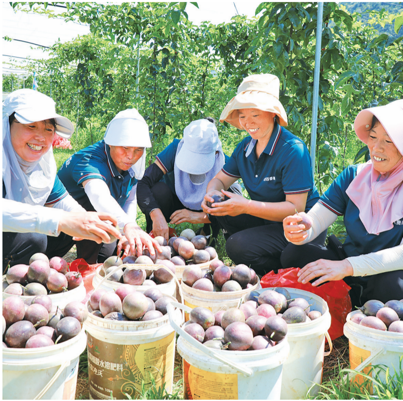
干群合力发展百香果产业。

在富源县，一支靠得住、顶得上、过得硬的党员先锋队正在加速成长。近年来，该县以党建为引领，探索构建选育管用一体化机制，为全县经济社会高质量发展注入了强劲的“红色动力”。