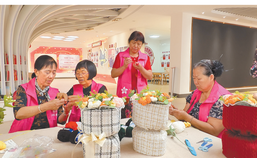
蒙自“美嬢嬢”编织花束。

“南湖夜校”“星星点灯”等特色项目,成为新市民结识邻里、认同城市、找到归属的“精神家园”;“环南湖文明实践圈”“南湖诗会”“金榜礼”等文化品牌活动,让文明渗透到