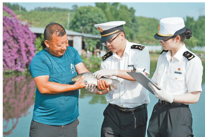
海关人员在瑞丽市出口鲤鱼养殖基地进行检查。

本报讯(记者 刘子语)瑞丽拥有丰富的天然淡水资源,全年水温适宜,加之毗邻东南亚的区位优势,吸引水产企业落地建厂,规模化开展淡水活鱼养殖与出口业务。今年前4个月,瑞丽海关关属监管出口活鱼316吨,货值3358万元,实现净增长。