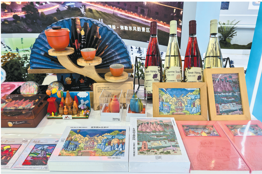
云南展区的文创产品展示。