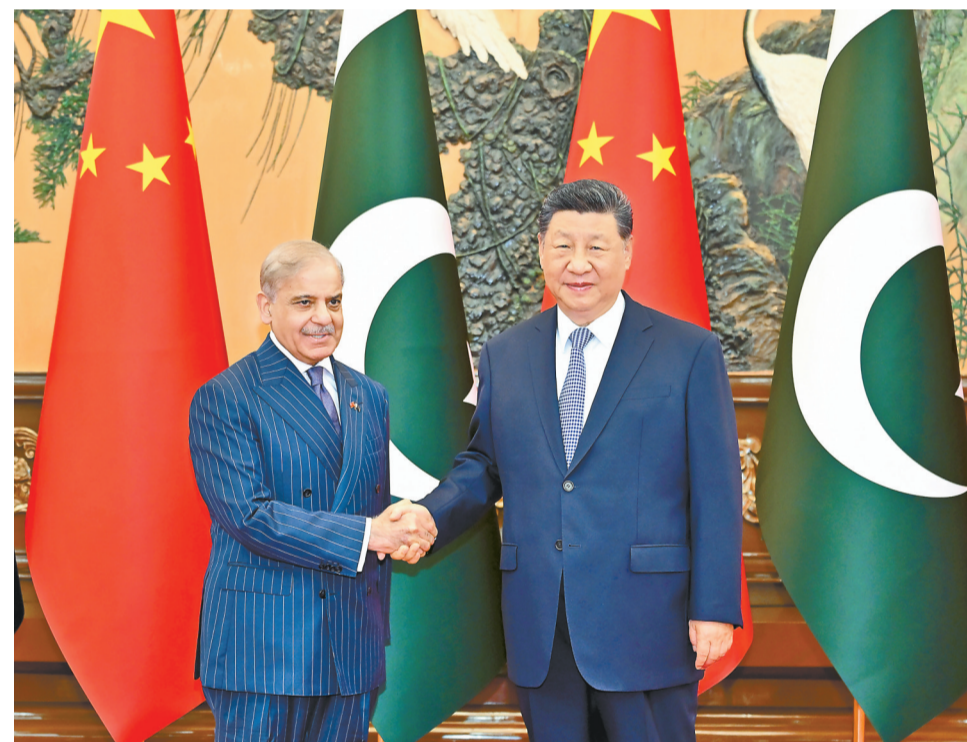
5月25日下午，国家主席习近平在北京人民大会堂会见来华进行正式访问的巴基斯坦总理夏巴兹。