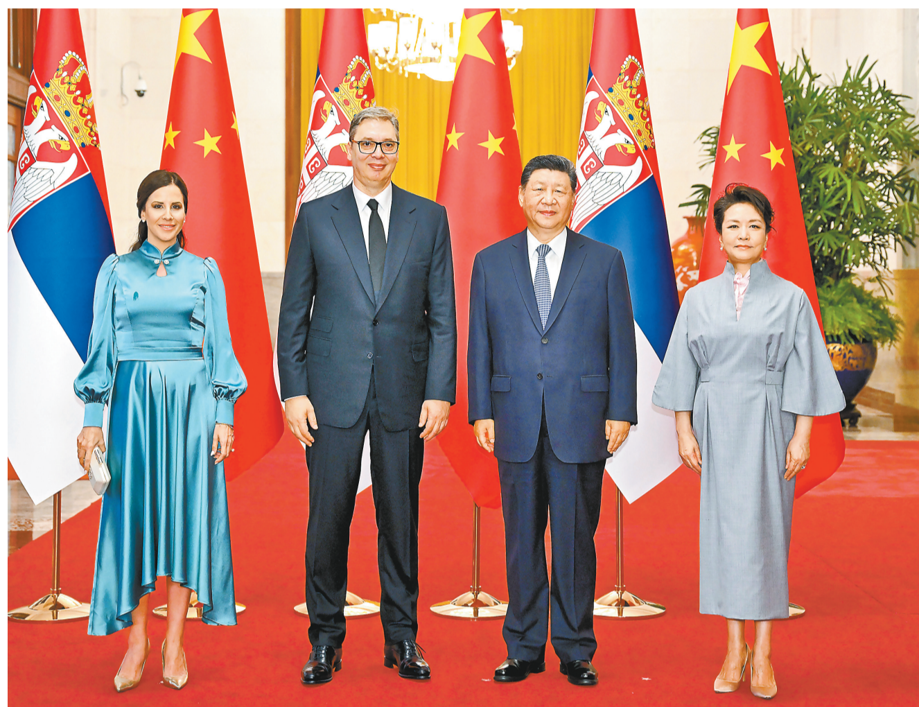
5月25日下午，国家主席习近平在北京人民大会堂同来华进行国事访问的塞尔维亚总统武契奇举行会谈。这是会谈前，习近平和夫人彭丽媛同武契奇和夫人塔玛拉合影。

新华社北京5月25日电(记者 杨依军) 5月25日下午，国家主席习近平在北京人民大会堂同来华进行国事访问的塞尔维亚总统武契奇举行会谈。 习近平指出，2024年我对塞尔维亚进行国事访问，双方共同开启构建新时代中塞命运共同体的崭新篇章。两年来，中塞命运共同体建设取得积极成果，既造福两国人民，也树立了国与国关系的典范。中塞两个民族都经历过苦难辉煌，都具有坚韧不拔、百折不挠的精神品质，都坚定追求独立自主、捍卫民族尊严，都对坚持和平发展、坚守公平正义有着深刻洞见。双方要加强交往、巩固互信、深化合作、相互支持，携手走出一条命运与共、共同繁荣的光明大道，推动中塞全面战略伙伴关系迈向新高度。