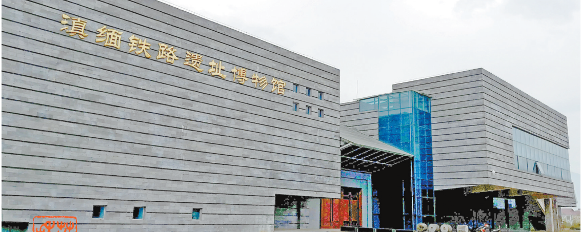
正在建设中的滇缅铁路遗址博物馆

滇缅铁路遗址博物馆，建于临沧市耿马傣族佤族自治县孟定镇忙蚌村滨河路边，这里也是曾经的滇缅铁路孟定站。博物馆铁青色的仿砖墙体庄严肃穆，外观造型与某些火车站颇有几分相似。走进一楼展厅，仿佛从深邃的隧道里奔驰而来的火车模型，汽笛轰鸣，把火车启动、行进、站台的鸣笛声模仿得十分逼真。展厅地面是钢化玻璃覆盖的轨枕，展厅两侧用实物、照片、雕塑展示了修筑滇缅铁路的情景。