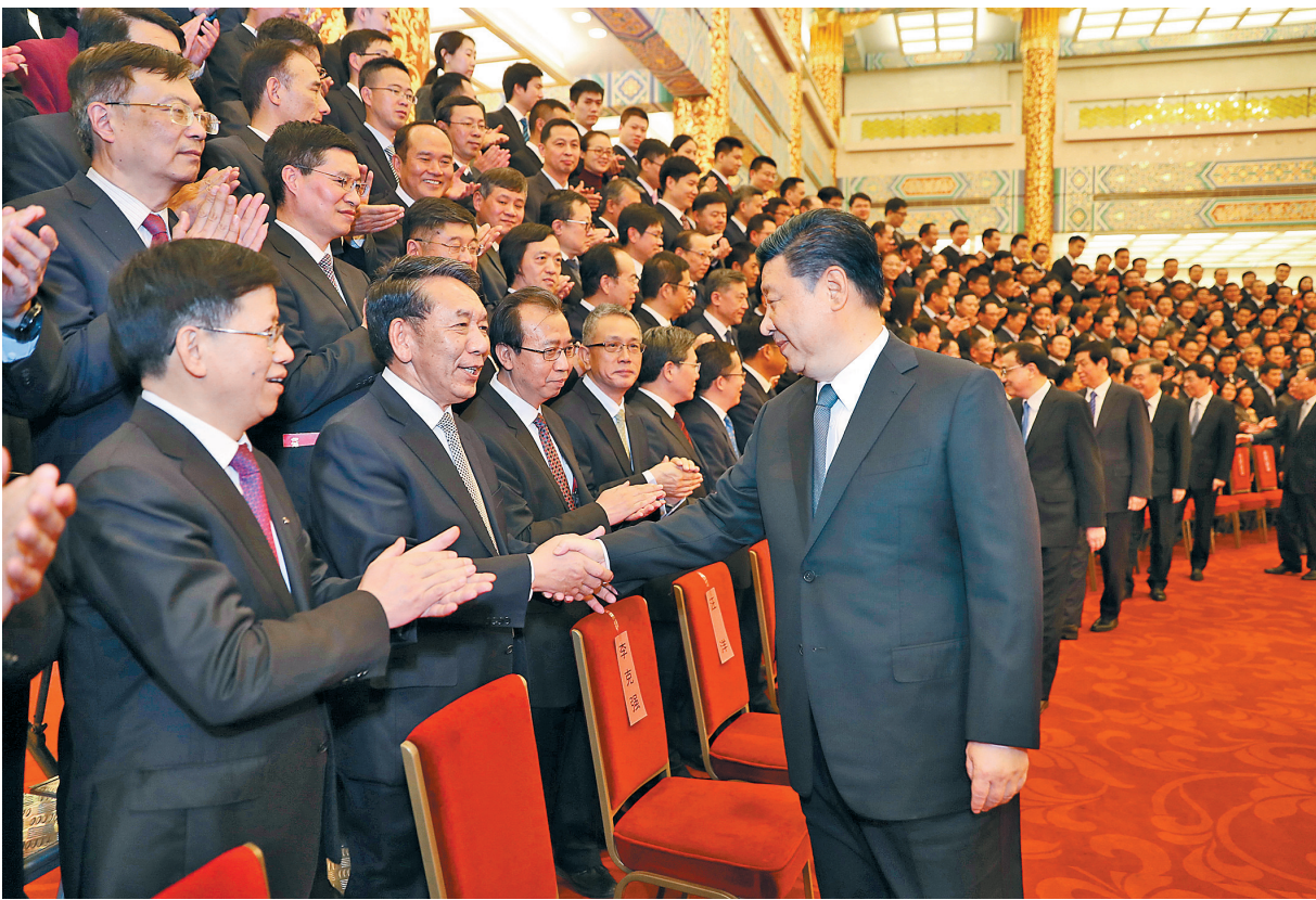
2月20日，党和国家领导人习近平、李克强、栗战书、汪洋、王沪宁、赵乐际、韩正等在北京人民大会堂会见探月工程嫦娥四号任务参研参试人员代表。

习近平指出，5年前，我们庆祝了嫦娥三号任务圆满成功。5年后，我们在这里庆祝嫦娥四号任务圆满成功。这次嫦娥四号任务，坚持自主创新、协同创新、开放创新，实现人类航天器首次在月球背面巡视探测，率先在月背刻上了中国足迹，是探索建