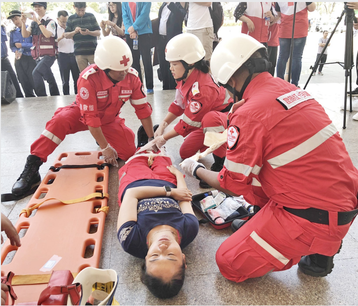
全省16个州(市)129个县(市、区)红十字会围绕“2019年红十字博爱周”活动主题,同步在各地组织开展了系列宣传纪念活动。

本报讯(记者 陈云芬)今年5月8日是第72个“世界红十字日”,省红十字会和省卫生健康委以“爱心相伴‘救’在身边”为主题,在昆明联合举办2019年“世界红十字日”纪念大会暨主题宣传活动,拉开了全省红十字会系统开展“2019年红十字博爱周”活动序幕。 纪念大会上,省红十字会、昆明市及相关县(区)红十字会干部职工、会员、志愿者进行了“我是红十字人”集体宣誓;对2018年以来向省红十字会和昆明市红十字会捐赠款物的部分爱心单位和爱心人士代表颁发了博爱捐助匾;为成功申请中国红十字基金会“小天使基金”项目资助的贫困白血病患儿童家庭发放了人道救助金。 活动现场,相关单位还进行了应急救援演练、装备展示、心肺复苏技能培训、义诊咨询、红十字运动基本知识宣传等志愿服务活动。