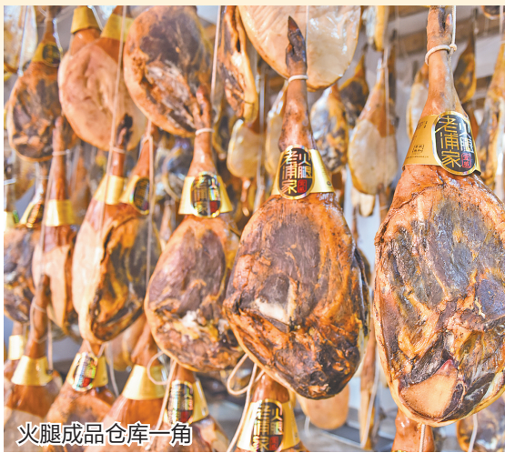
火腿成品仓库一角