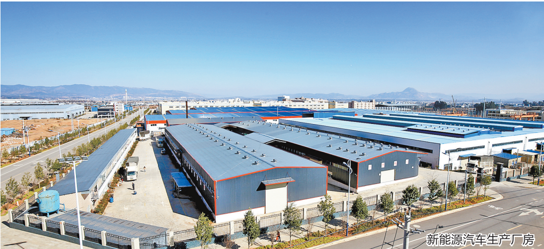
新能源汽车生产厂房