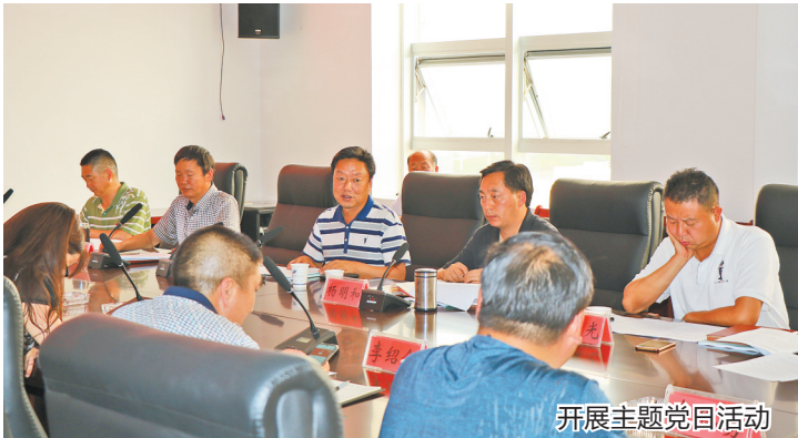
开展主题党日活动