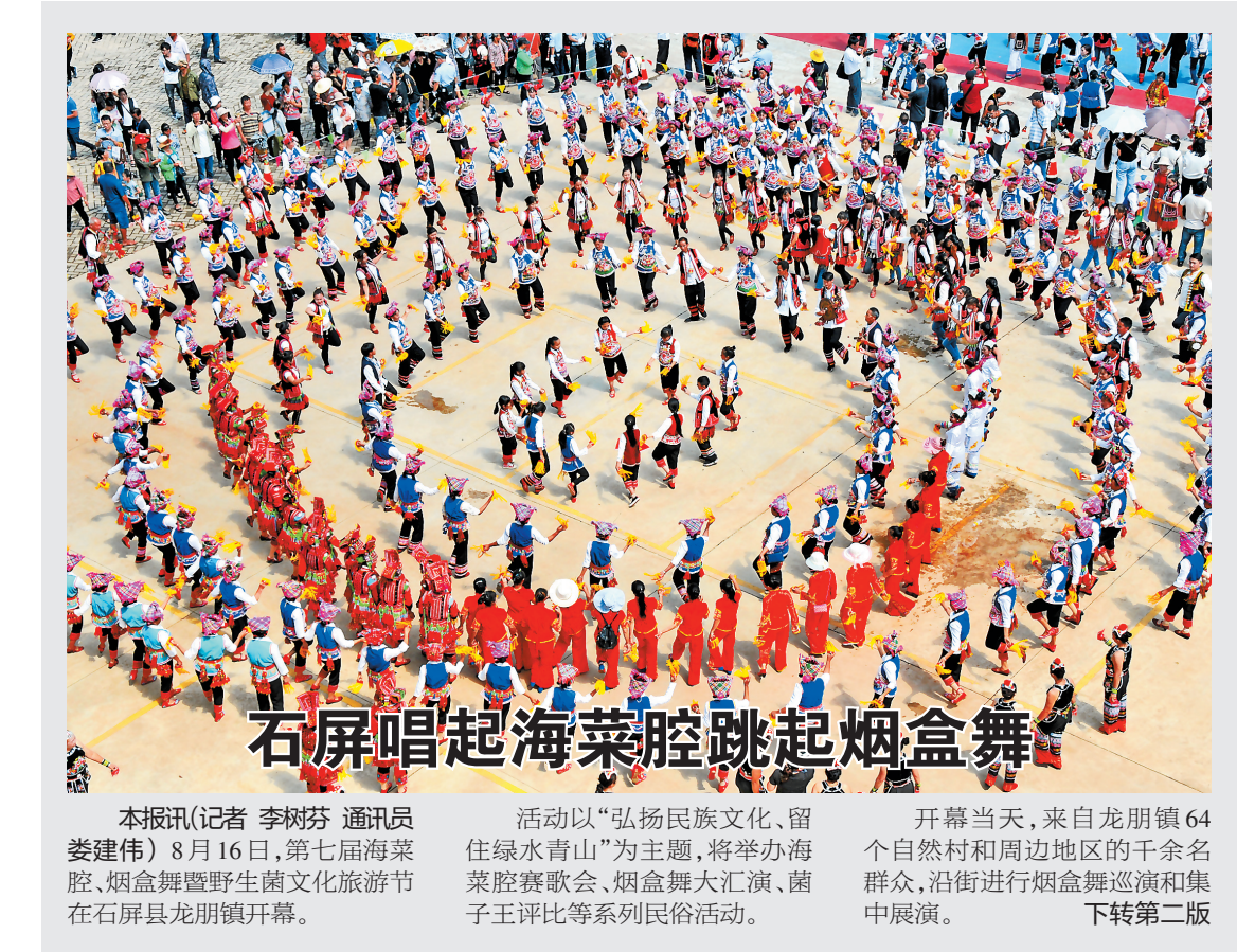
石屏唱起海菜腔跳起烟盒舞

在曼因老寨所属的曼因村委会,茶叶作为主要的经济支柱产业,种植面积达22000余亩。不仅和岩恩一样的171户建档立卡贫困户如