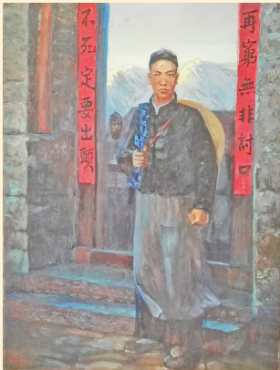
周保中将军纪念馆内展现周保中离家从军求学的油画