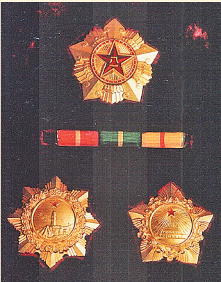
国务院授予周保中的一级八一勋章、一级独立自由勋章和一级解放勋章