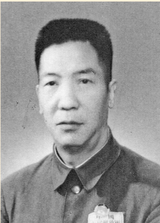
1949年10月，周保中参加开国大典出席证上的照片