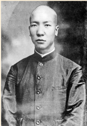
1924年10月，周保中在云南陆军讲武学校的毕业照

1928年7月25日，周保中从南京写了一封信给当时在大理的结拜兄弟赵荣光。此信是在他入党后一年，革命处于低潮时写的，信