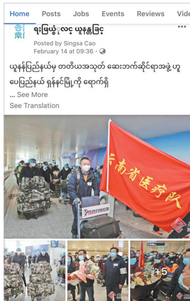
“魅力云南”缅语账号