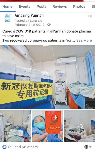
“魅力云南”英文账号