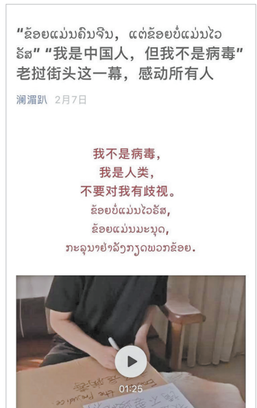
多语种微信公众号“澜湄叭”