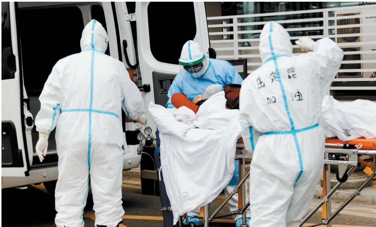
2月19日，一支由3辆救护车和9名医务人员组成的云南省首个重症转运队驰援武汉。在武汉同济医院光谷院区，他们争分夺秒与死神赛跑，每天接送新冠肺炎患者往返住院楼与影像检查室之间，成为抗疫阻击战中的生命“摆渡人”。