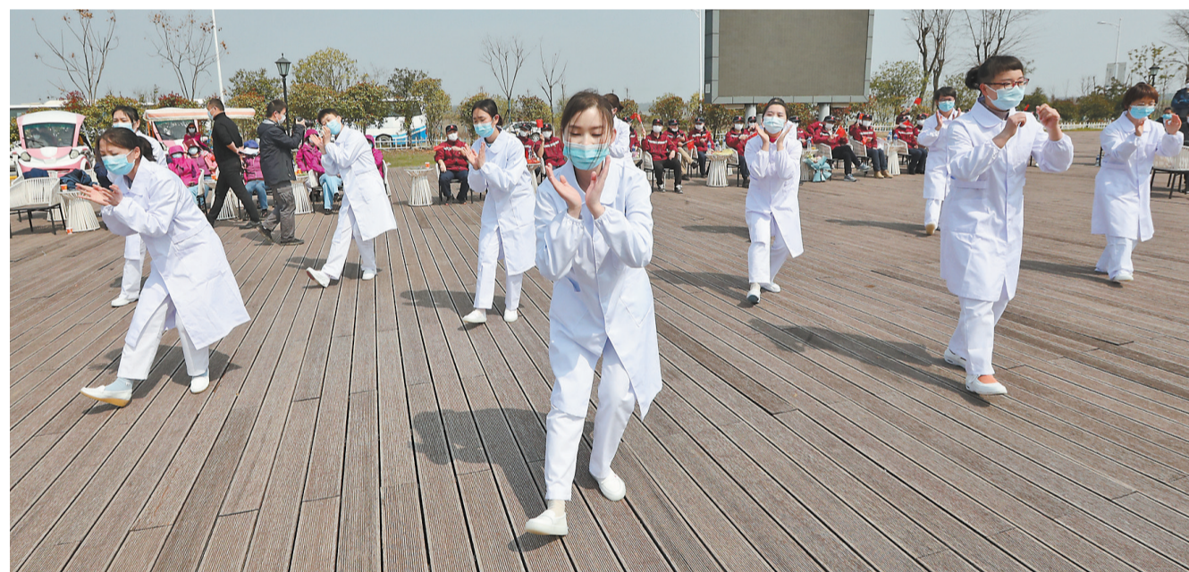
在文艺联欢中，云南医疗队的队员展现出美丽的另一面，也加深了云南与咸宁的情谊。 从3月14日开始，这批队员又将上

来自咸宁的文艺团队，为云南医疗队带来了精彩歌舞和乐器表演，十几个节目下来，满是欢乐，也满是感动，