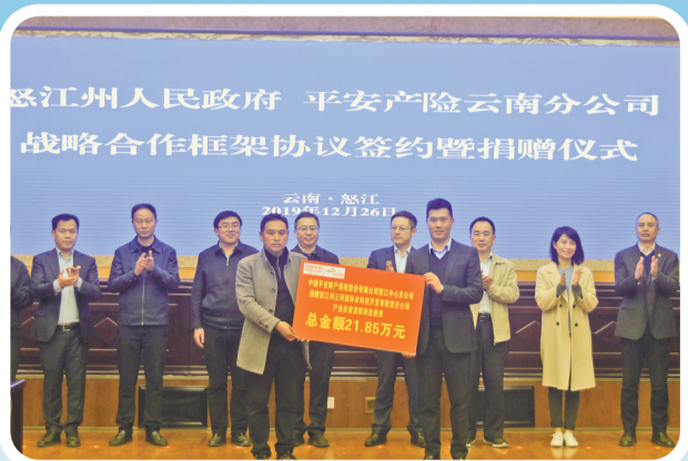
平安产险“村官”产业扶贫贴息贷款落地怒江州