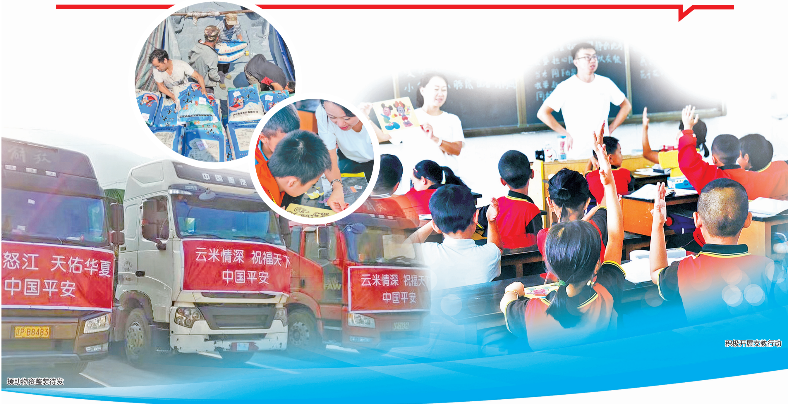
援助物资整装待发

资——价值5.5万元的1000袋怒江大米到达云南省急救中心,向云南省急救中心全体医护人员表达暖心慰问;平安普惠云南分公司于4月1日将一批价值5.5万元的抗疫生活物资怒江大米10吨送到昆明市盘龙区人民政府,为该区救灾救济、双拥安置、社会福利等工作送上爱心。据悉,此次平安捐赠的大米采购至怒江扶贫地区,帮助建档立卡贫困群众增收,在支持抗疫的同时,助力脱贫攻坚。