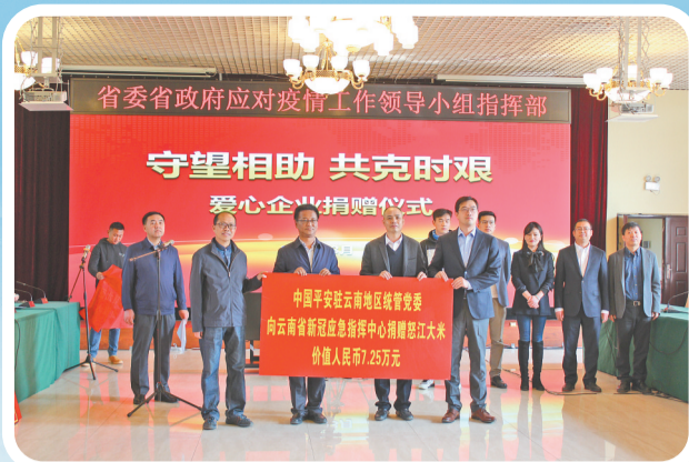
平安产险云南分公司捐助省委省政府应对疫情工作领导小组指挥部物资