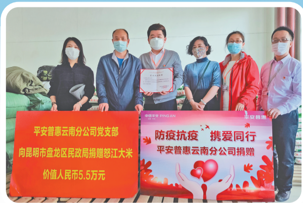
平安普惠云南分公司捐助昆明市盘龙区人民政府物资