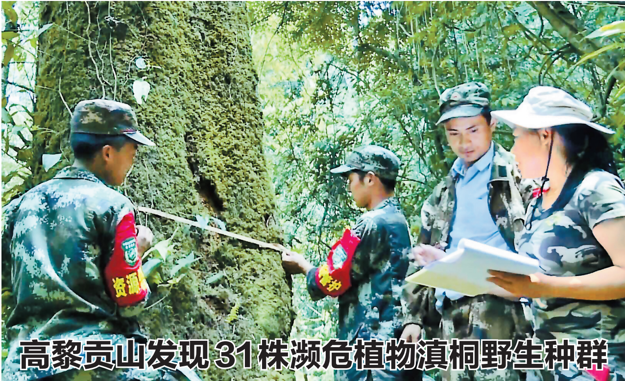
高黎贡山发现31株濒危植物滇桐野生种群

截至目前,全省各类低收入群体1至3月价格临时补贴55334.24万元已及时足额发放到位,惠及1007.54万人次。其中,向困难群众发放48928.91万元,惠及912.79万人次;向优抚对象发放5110.83万元,惠及84.53万人次;向失业人员发放1294.5万元,惠及10.22万人次。