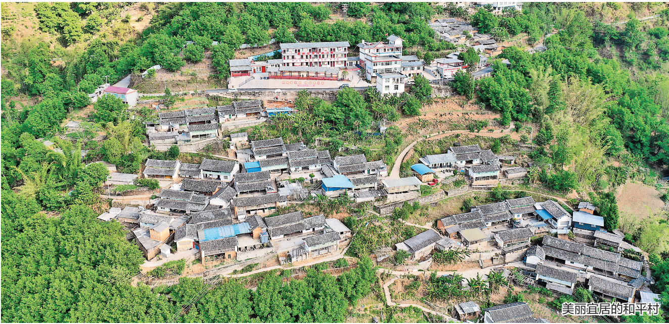
美丽宜居的和平村

2010年,昆明市第一人民医院率先在全省实现第1例DCD器官捐献。截至目前,在省、市红十字会和卫健委及省内服务区域医院单位的支持下,昆明市第一人民医院共完成309例器官捐献,共完成肝移植手术214例、肾移植手术530例、心脏移植31例、肺移植10例、胰腺移植2例、角膜移植597例。