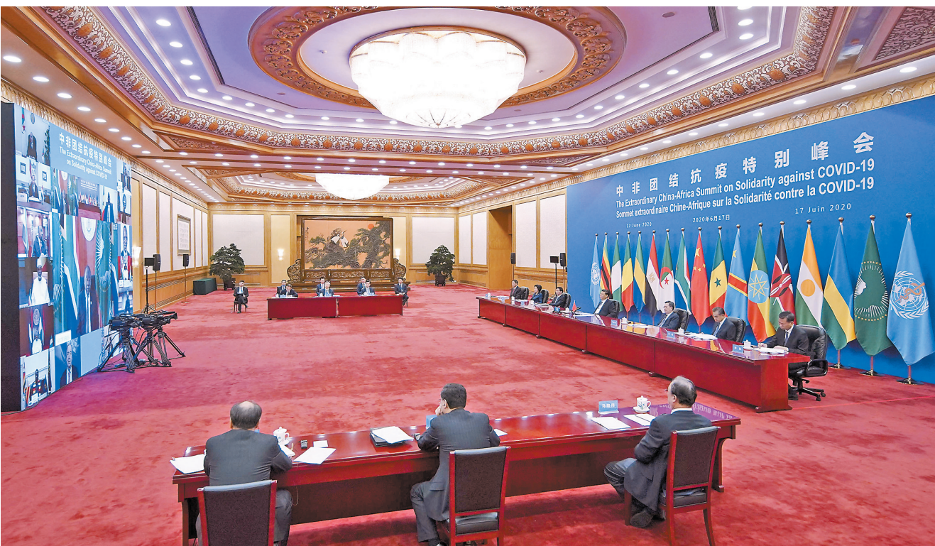
6月17日晚,国家主席习近平在北京主持中非团结抗疫特别峰会。本次峰会由中国和非洲联盟轮值主席国南非、中非合作论坛共同主席国塞内加尔共同发起,以视频方式举行。