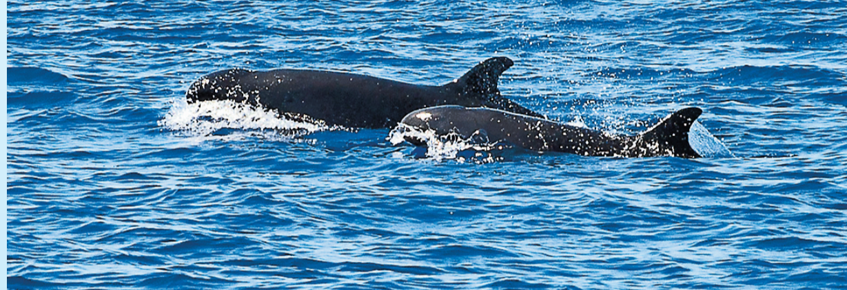
7月18日，中国南海北部某海域出现伪虎鲸群体。据悉，这是我国科研人员第一次在该海域发现并记录到该类动物群体。伪虎鲸隶属于海豚科，是国家二级保护动物。图为7月18日在南海北部某海域拍摄的伪虎鲸。